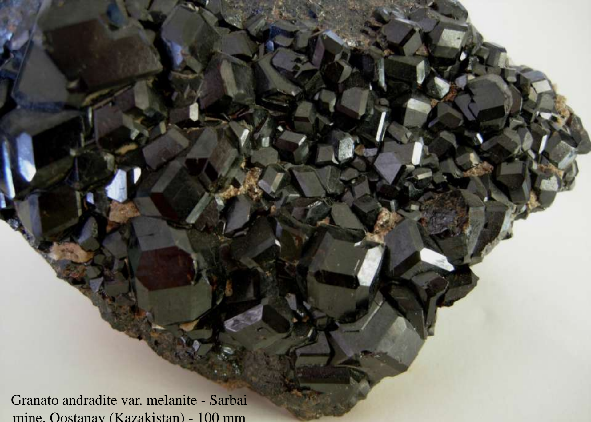
Granato andradite var. melanite - Sarbai mine, Qostanay (Kazakistan) - 100 mm