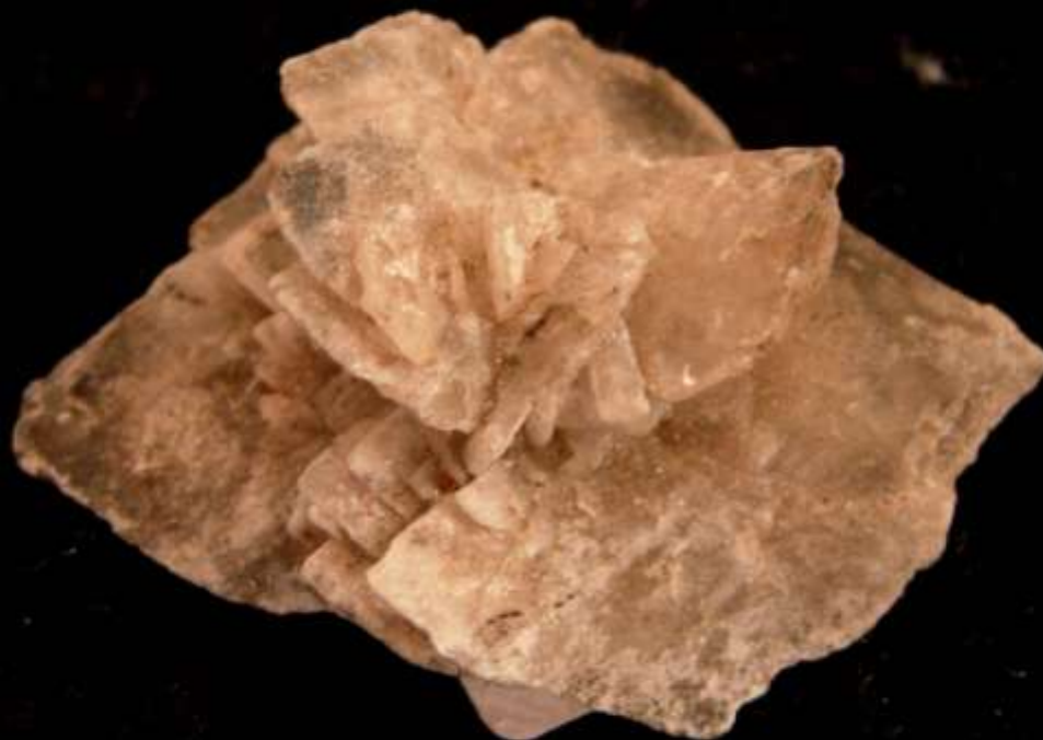
Glauberite - Camp Vert Salt, Arizona (USA) -35 mm