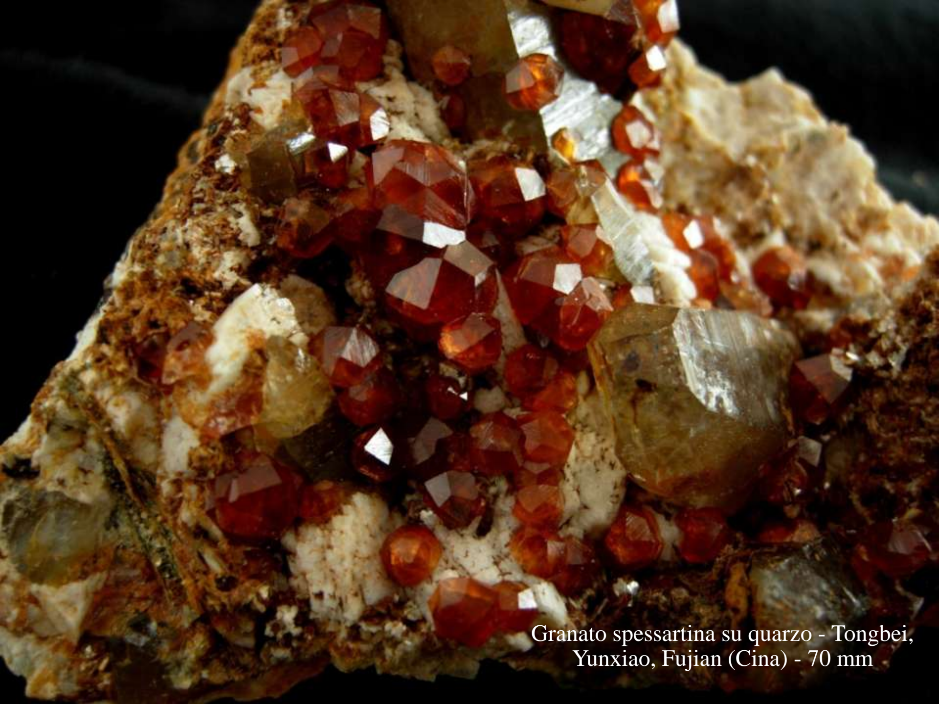
Granato spessartina su quarzo - Tongbei, Yunxiao, Fujian (Cina) - 70 mm