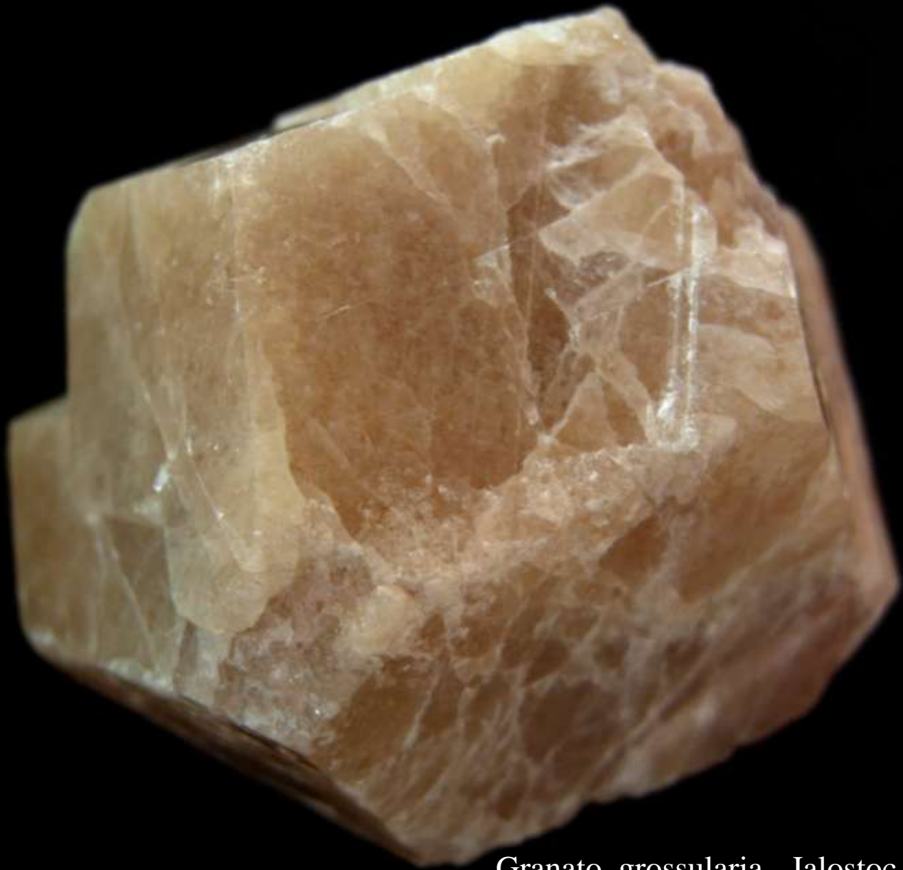
Granato grossularia - Jalostoc, Ayala, Chihuahua (Messico) - 50 mm