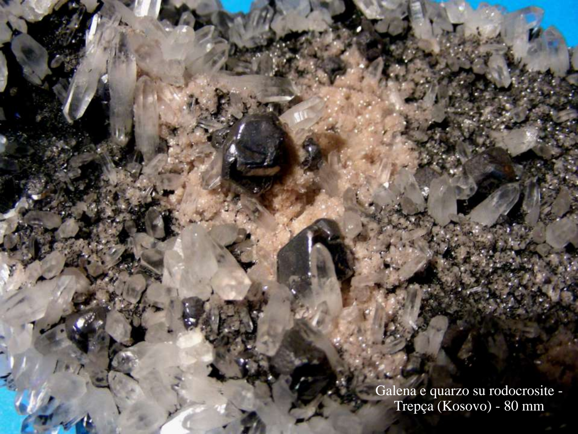
Galena e quarzo su rodocrosite - Trepça (Kosovo) - 80 mm