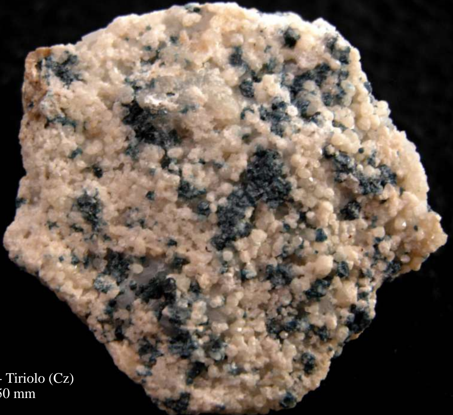
Gahnite - Tiriolo (Cz) - 50 mm