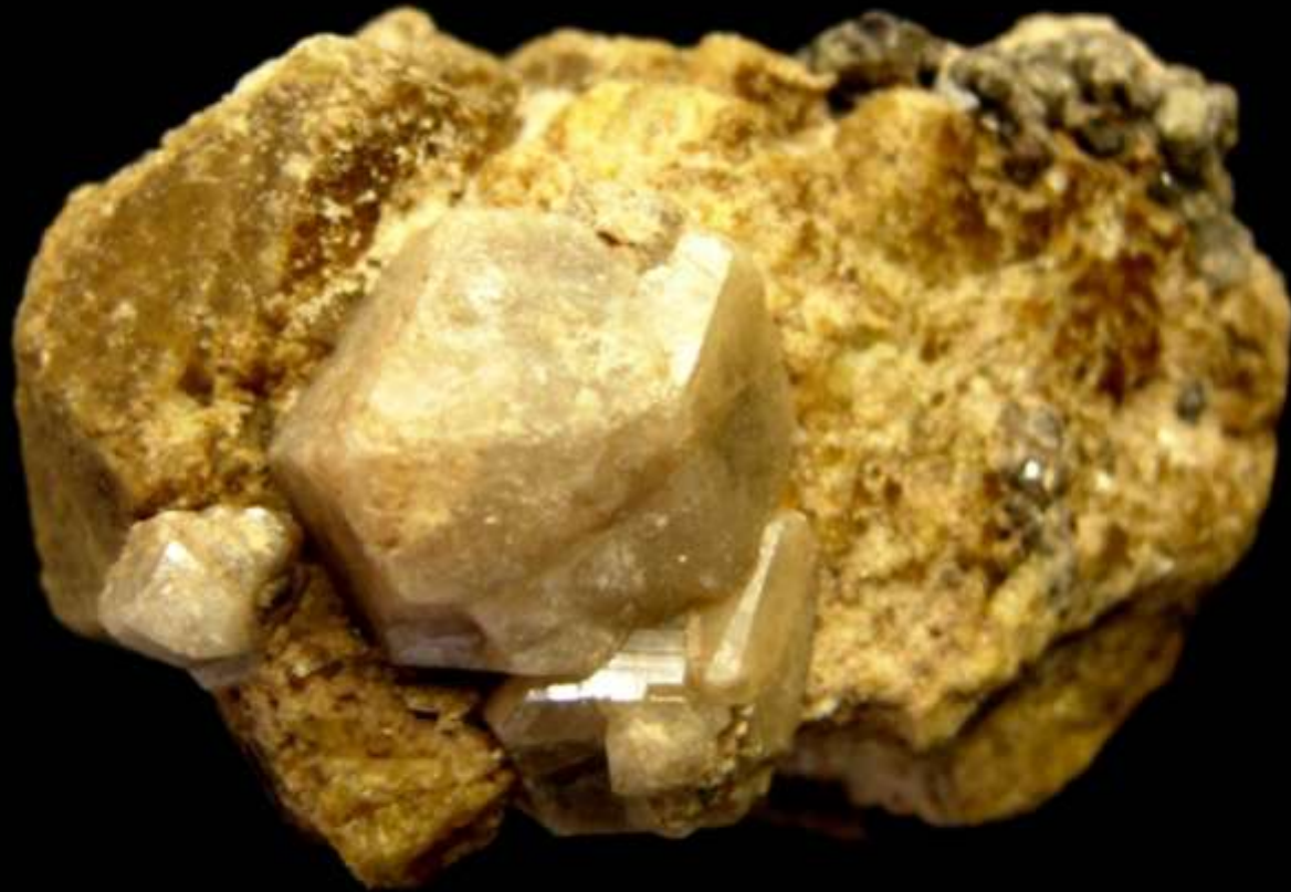
Granato grossularia su vesuvianite - Jalostoc, Ayala, Chihuahua (Messico) - 50 mm