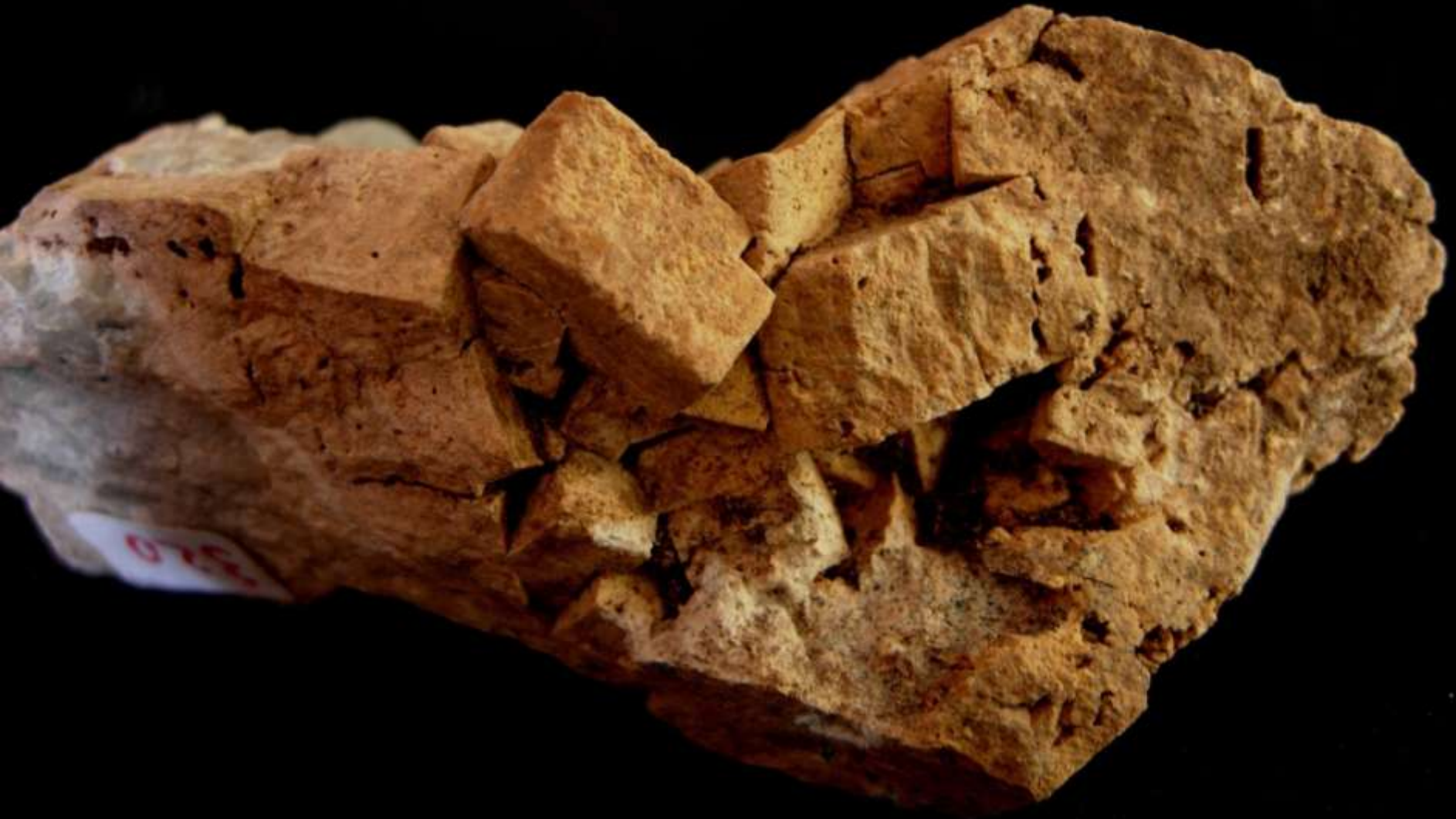
Gehlenite - Monzoni, Val di Fassa (Tn) - 60 mm