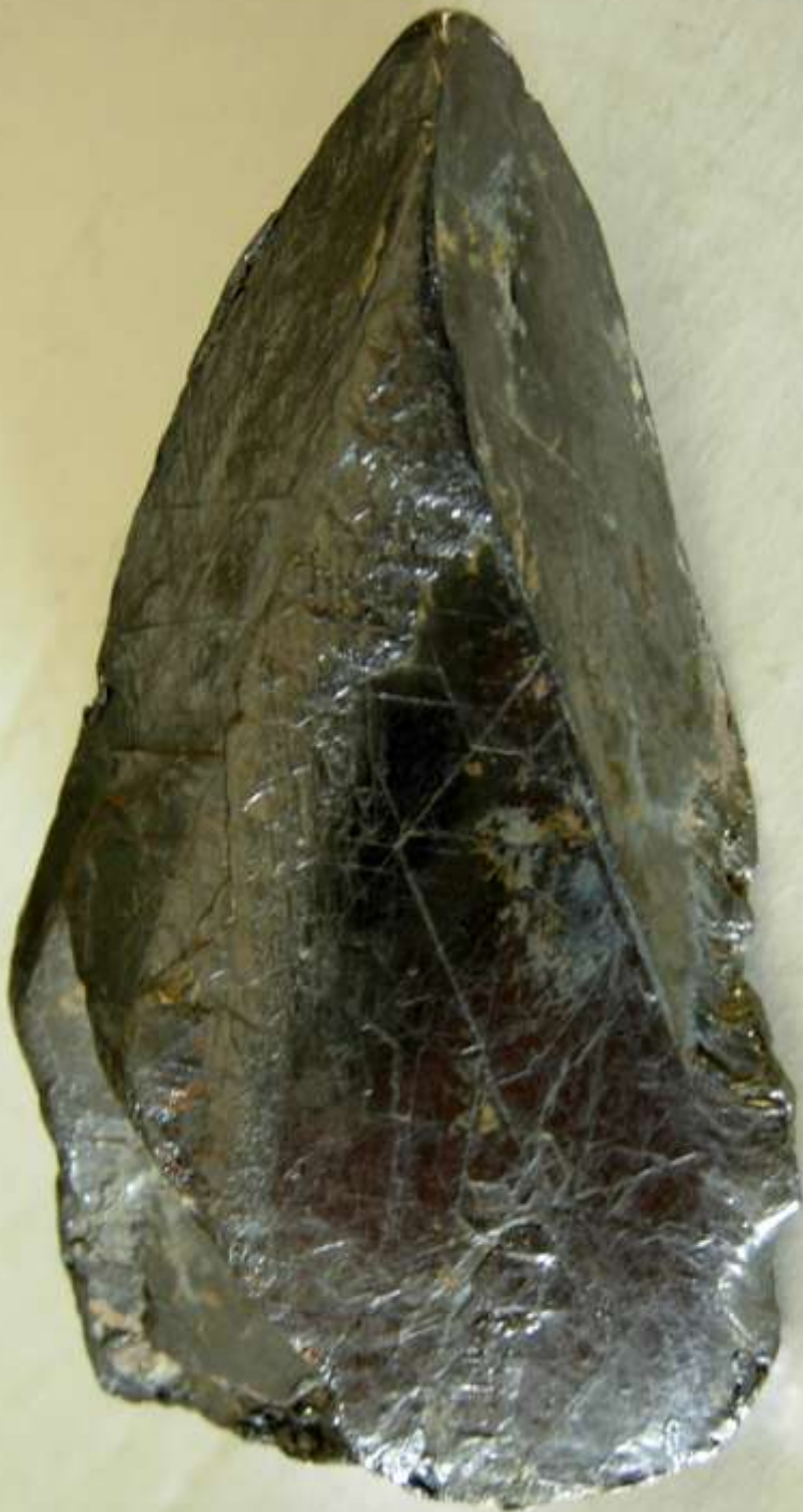
Grafite - Bogala mine, Bogala, Kegalle Dist., Sabaragamuwa Province (Sri Lanka) - 100 mm