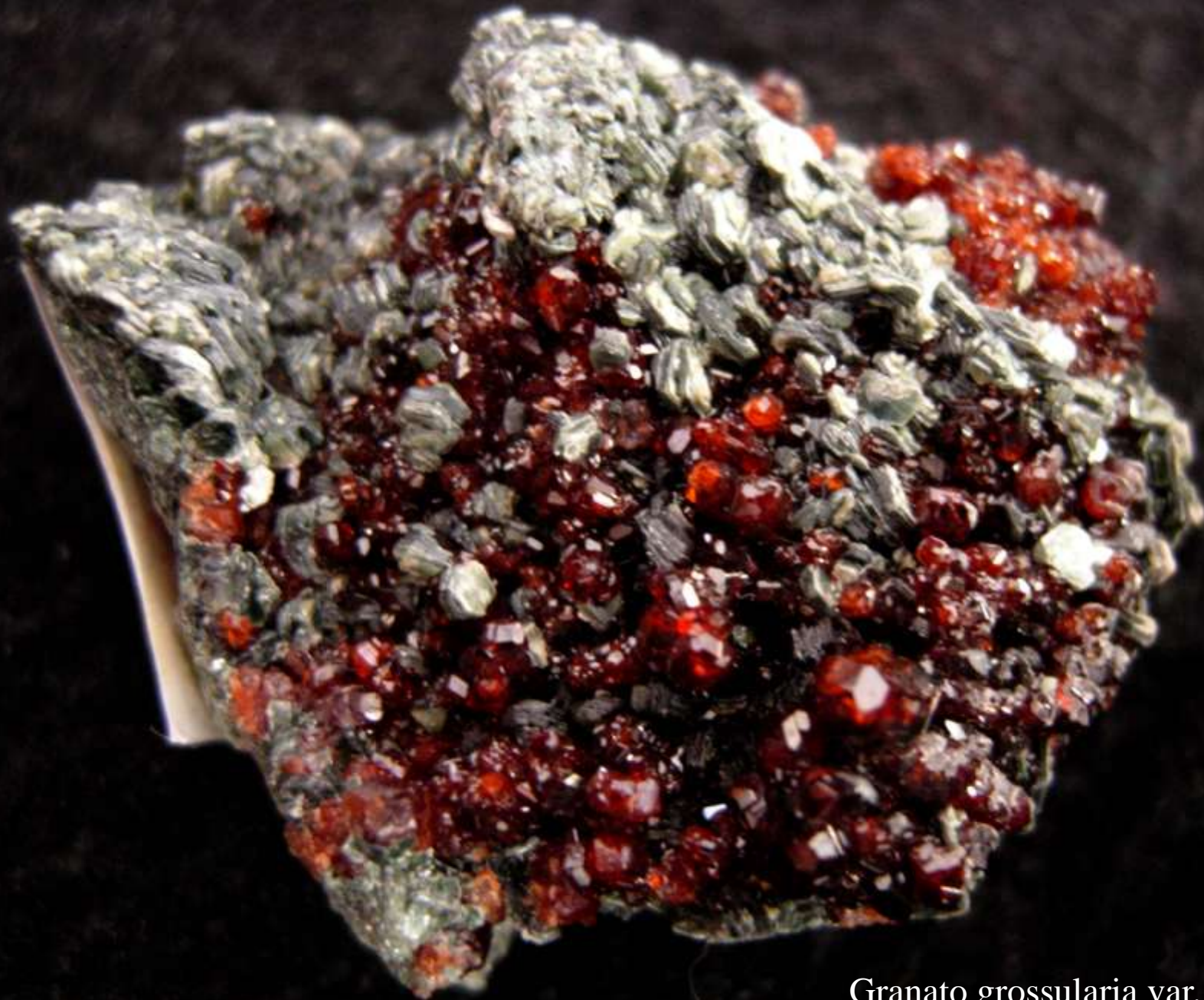
Granato grossularia var. hessonite - Val d'Ala (Piemonte) - 40 mm