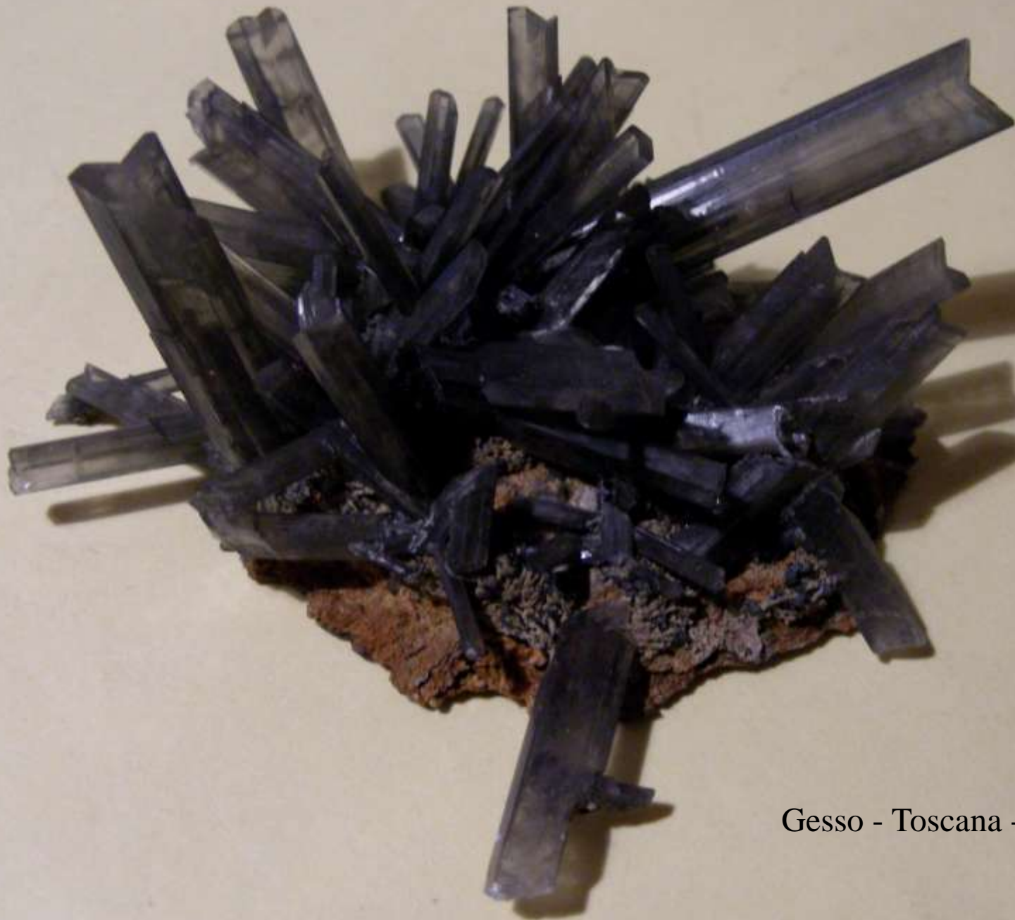
Gesso - Toscana - 80 mm