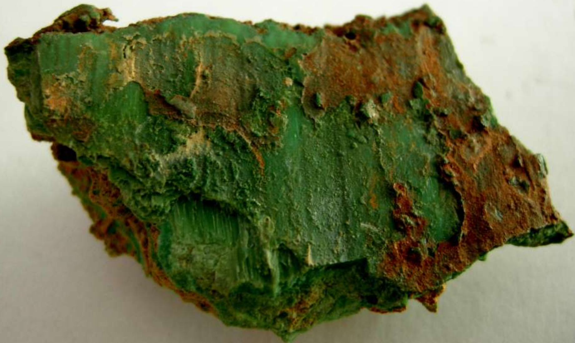
Garnierite - Nuova Caledonia - 40 mm