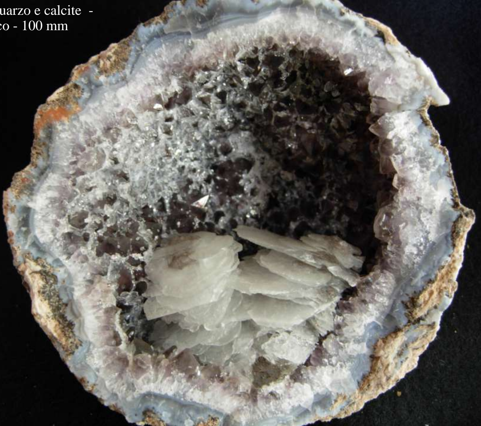
Geode di quarzo e calcite - Messico - 100 mm