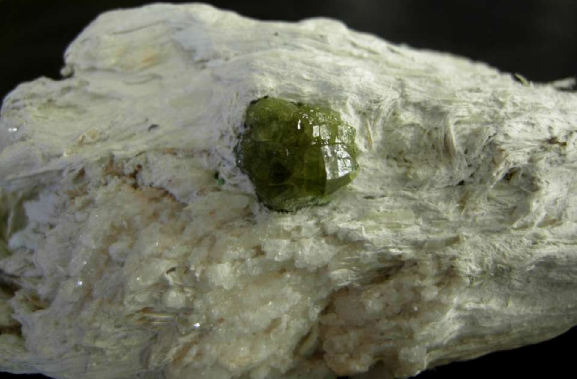
Granato andradite var. demantoide e amianto - Sferlún, Val Malenco (So) - 60 mm