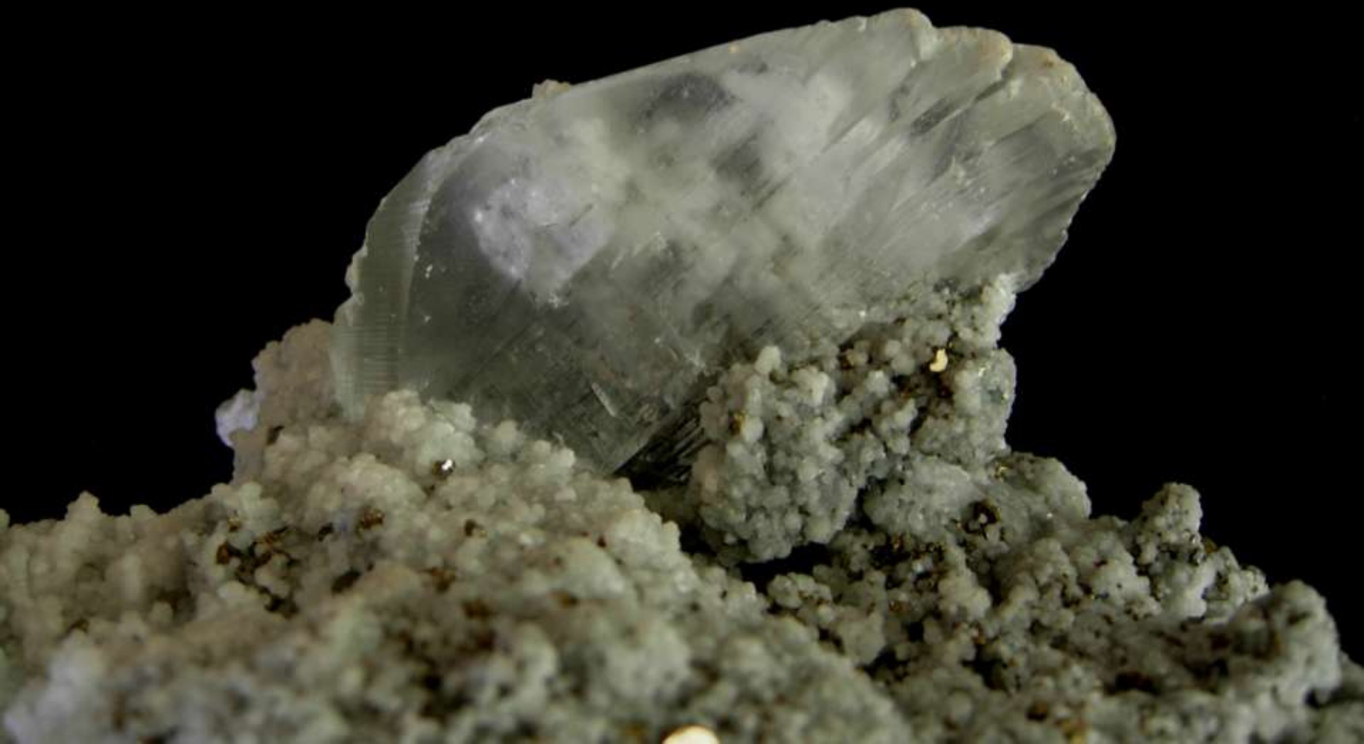
Gesso - min. Niccioleta (Gr) , Toscana - 140 mm