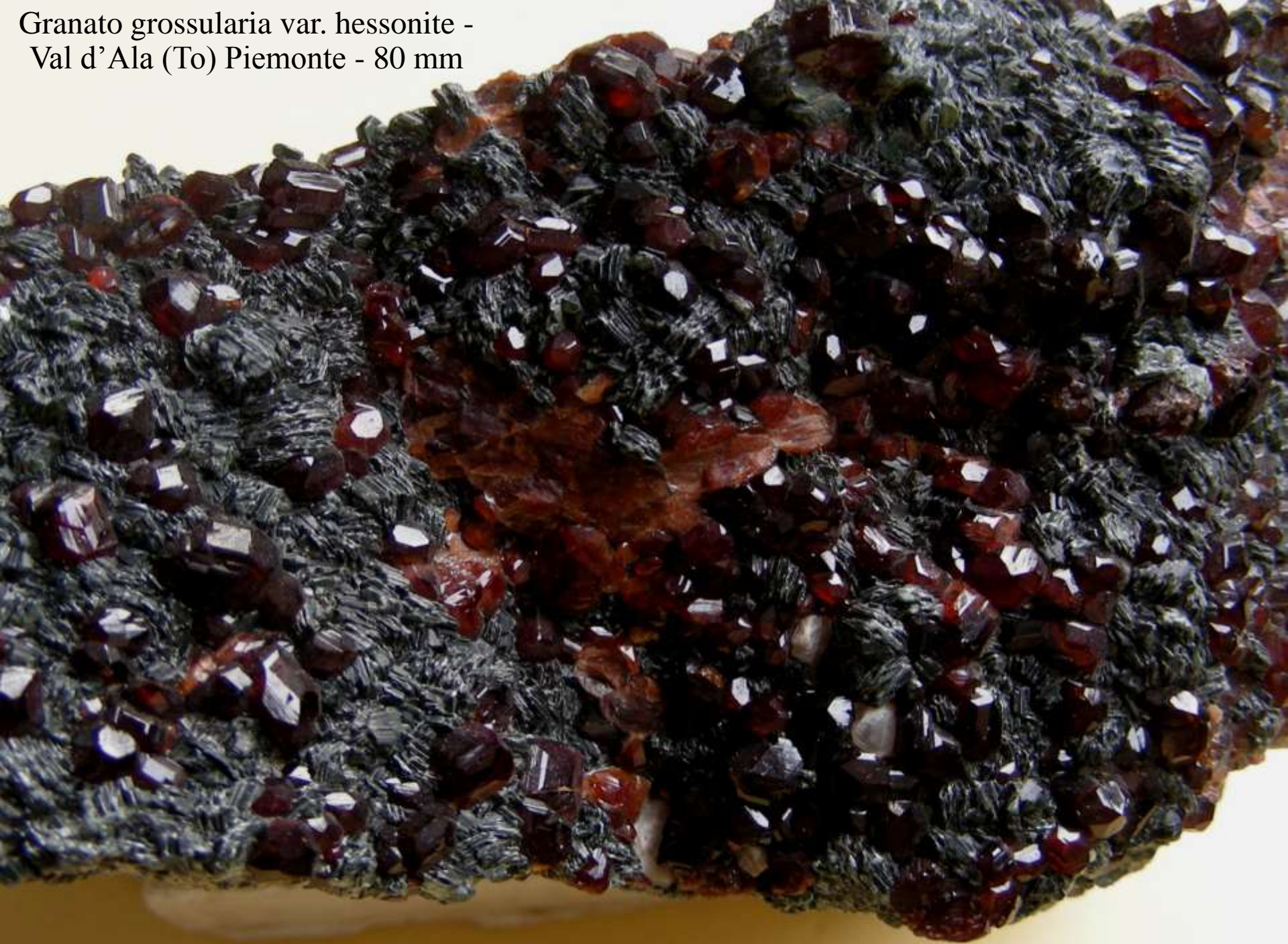
Granato grossularia var. hessonite - Val d'Ala (To) Piemonte - 80 mm