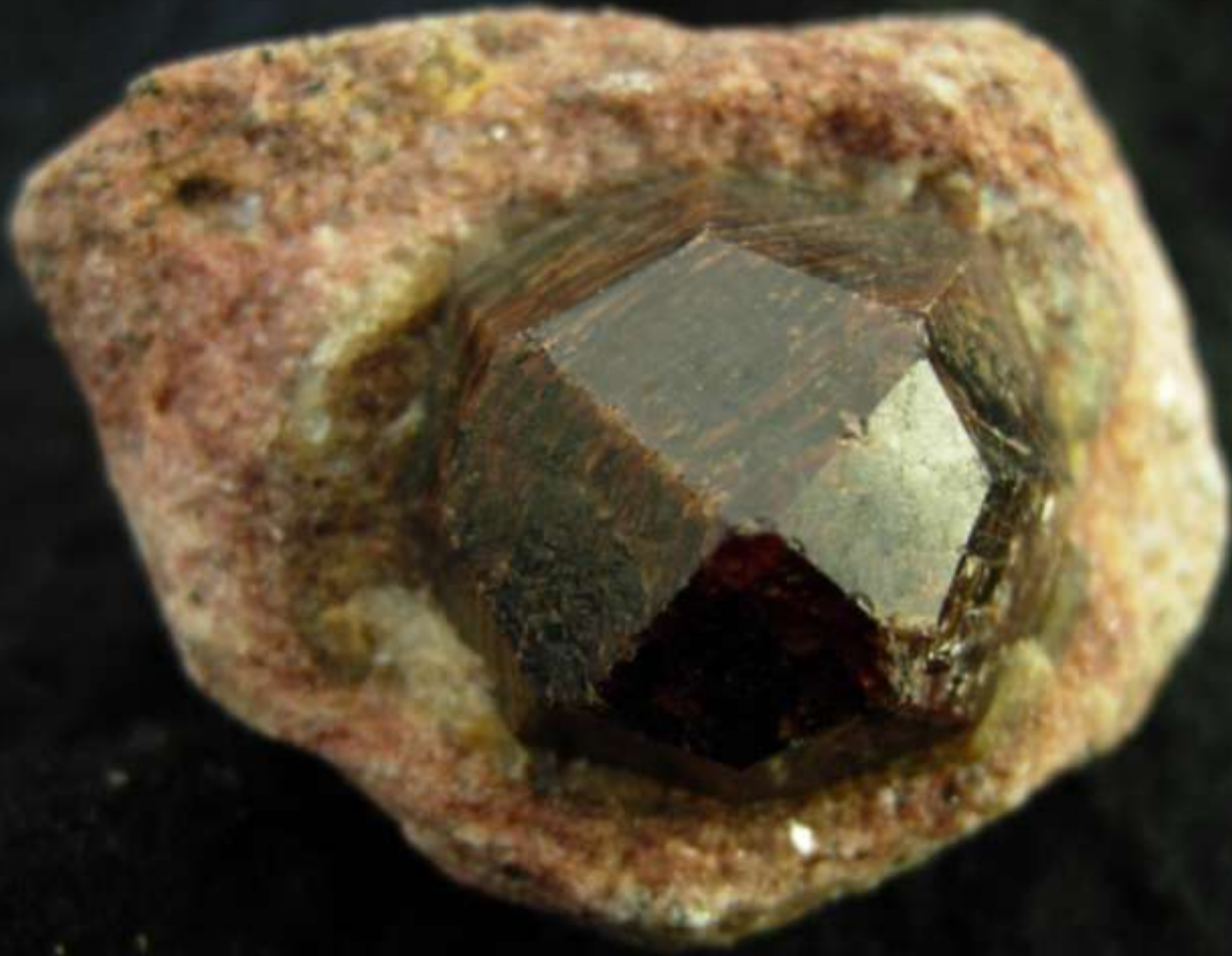
Granato - Minas Gerais (Brasile) - 50 mm