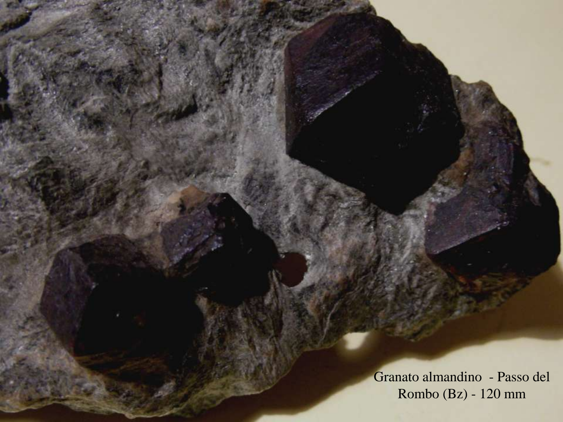
Granato almandino - Passo del Rombo (Bz) - 120 mm