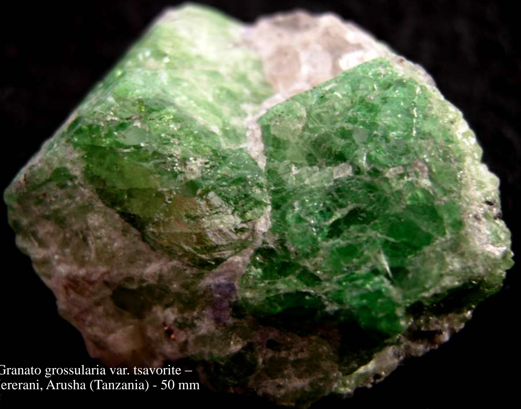
Granato grossularia var. tsavorite – Mererani, Arusha (Tanzania) - 50 mm