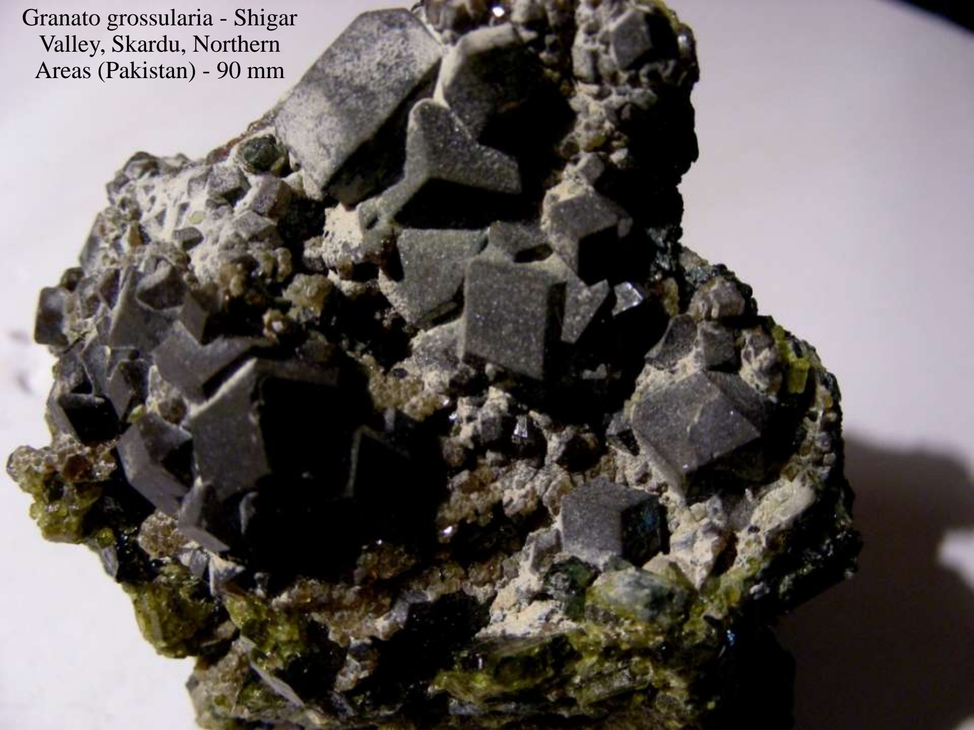
Granato grossularia - Shigar Valley, Skardu, Northern Areas (Pakistan) - 90 mm