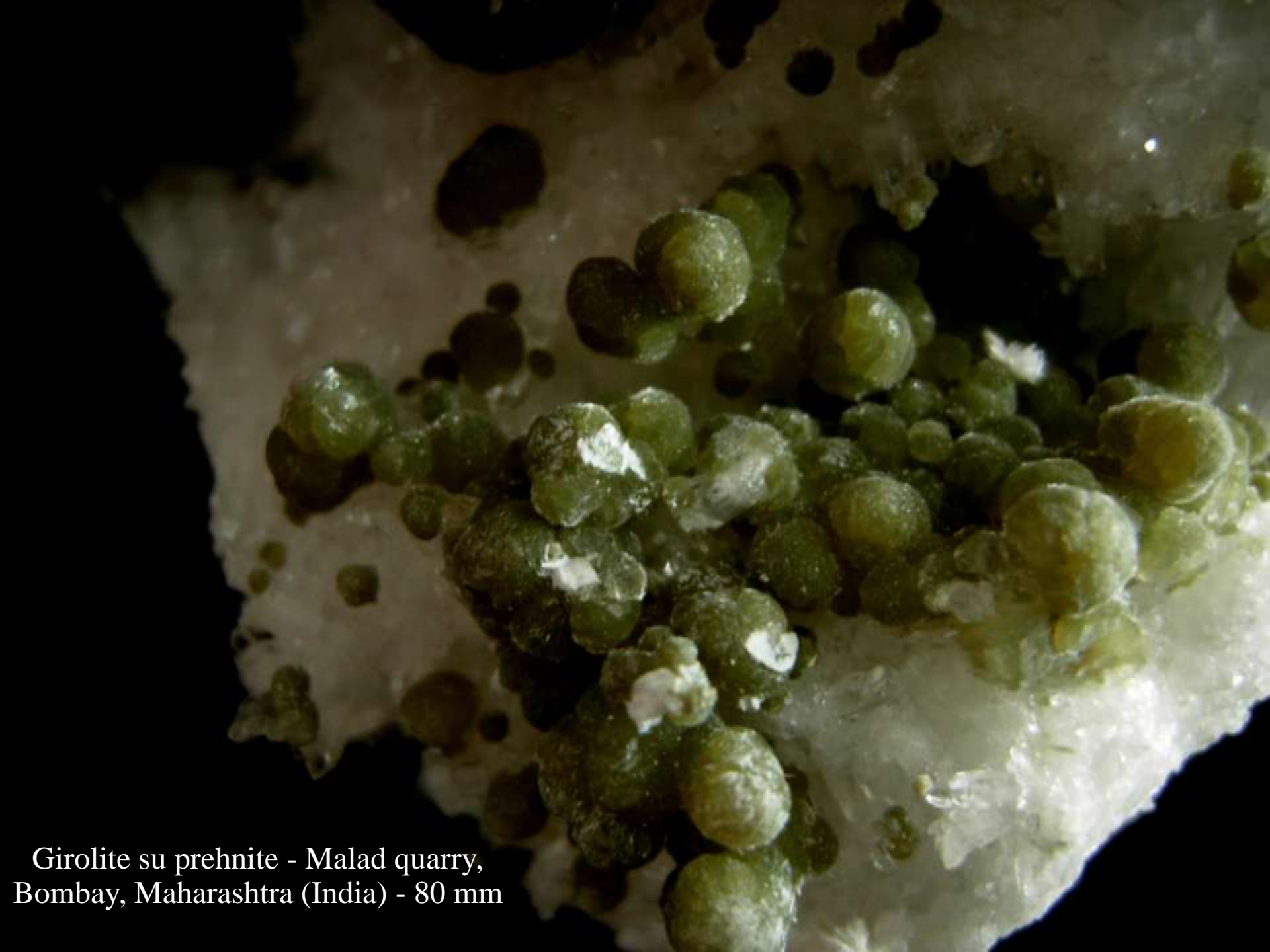
Girolite su prehnite - Malad quarry, Bombay, Maharashtra (India) - 80 mm