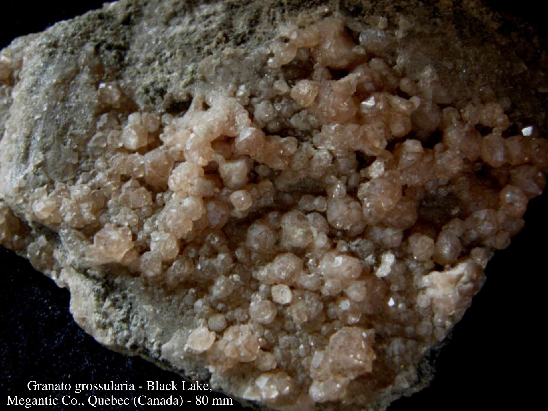
Granato grossularia - Black Lake, Megantic Co., Quebec (Canada) - 80 mm