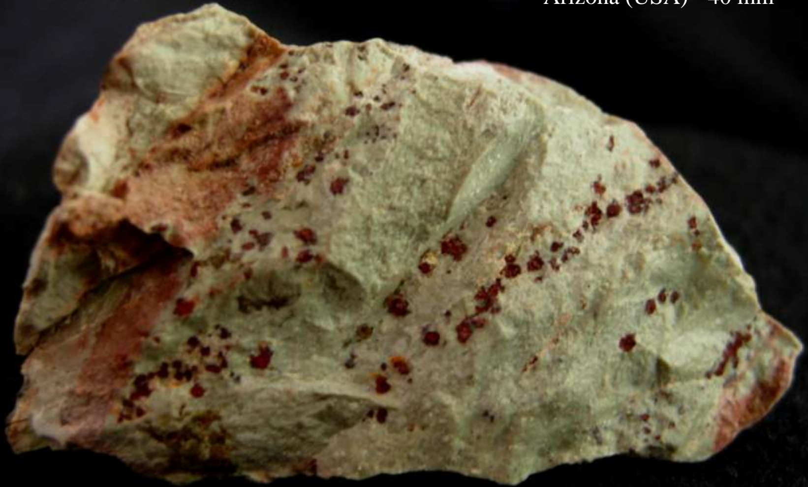
Fornacite - Vekol mine, Pinal Co., Arizona (USA) - 40 mm