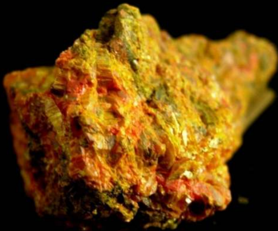
Getchellite - Getchell mine, Golconda, Humboldt Co., Nevada (USA) - 40 mm