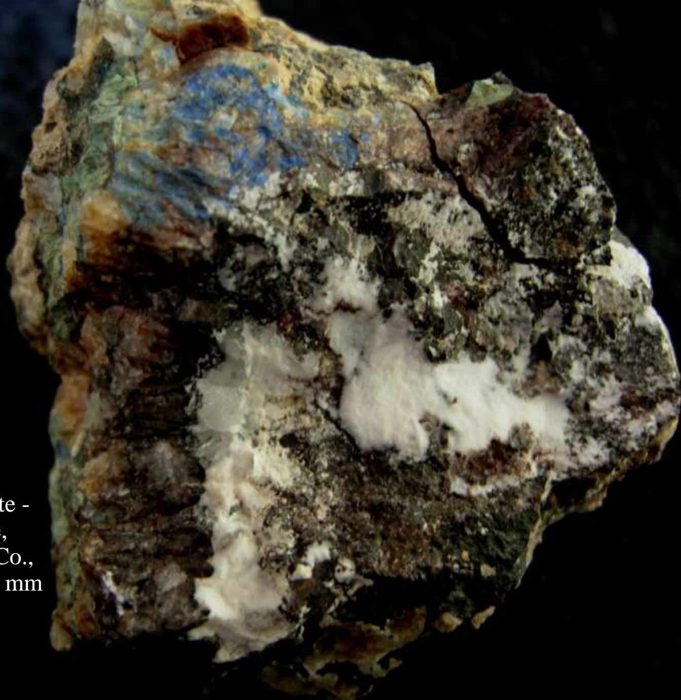
Gearksutite e linarite - Grand Reef mine, Aravaipa, Graham Co., Arizona (USA) - 60 mm