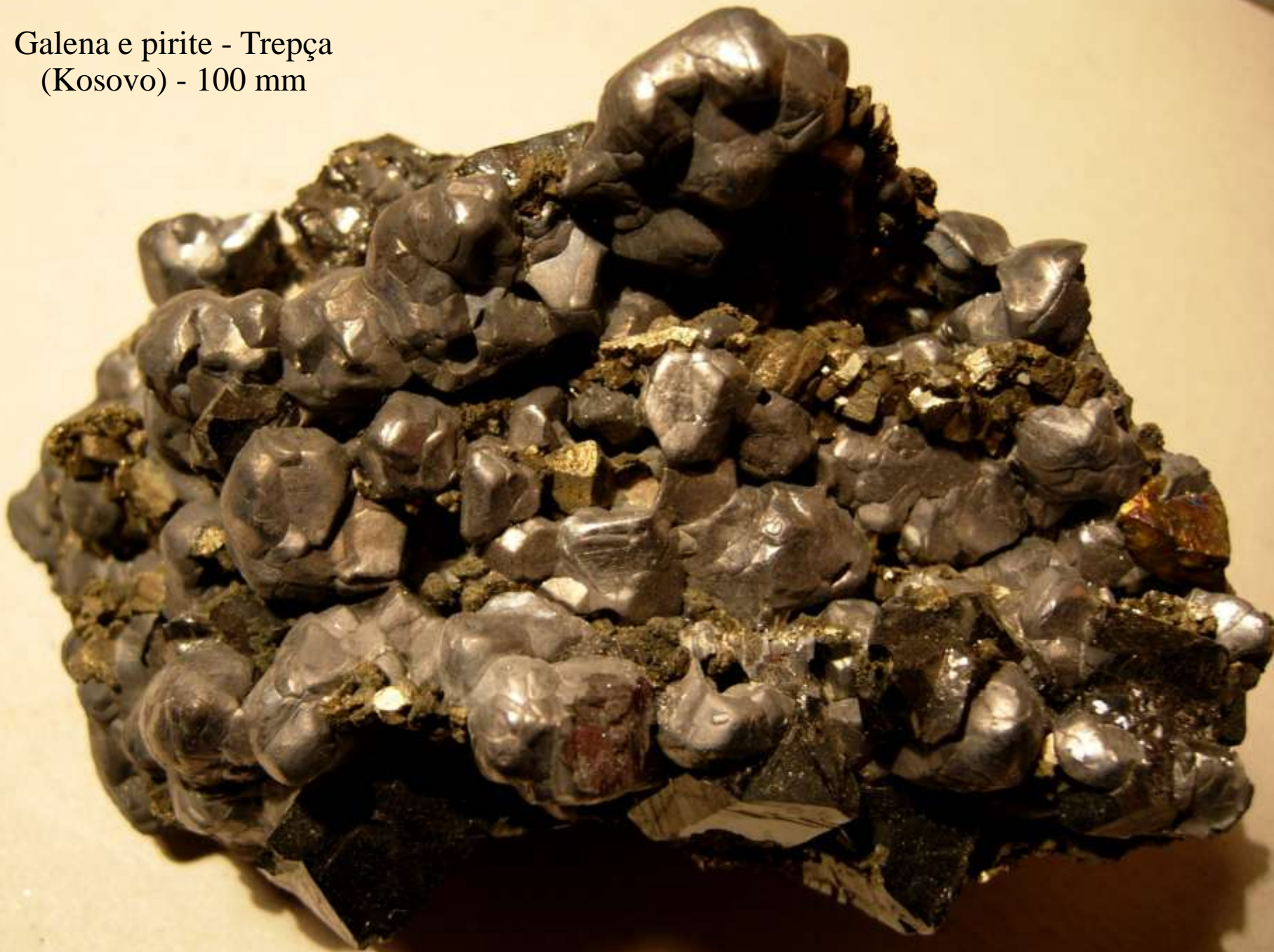
Galena e pirite - Trepça (Kosovo) - 100 mm