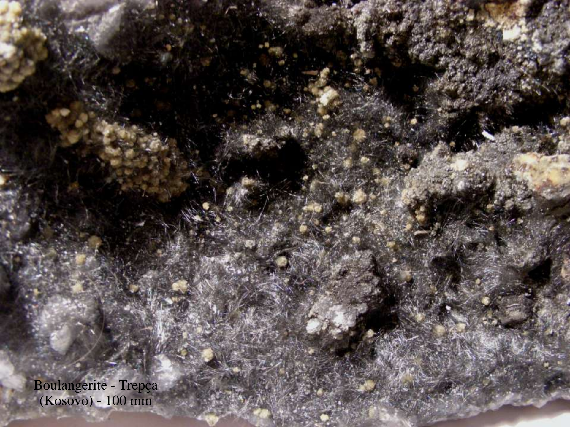
Boulangerite - Trepça (Kosovo) - 100 mm