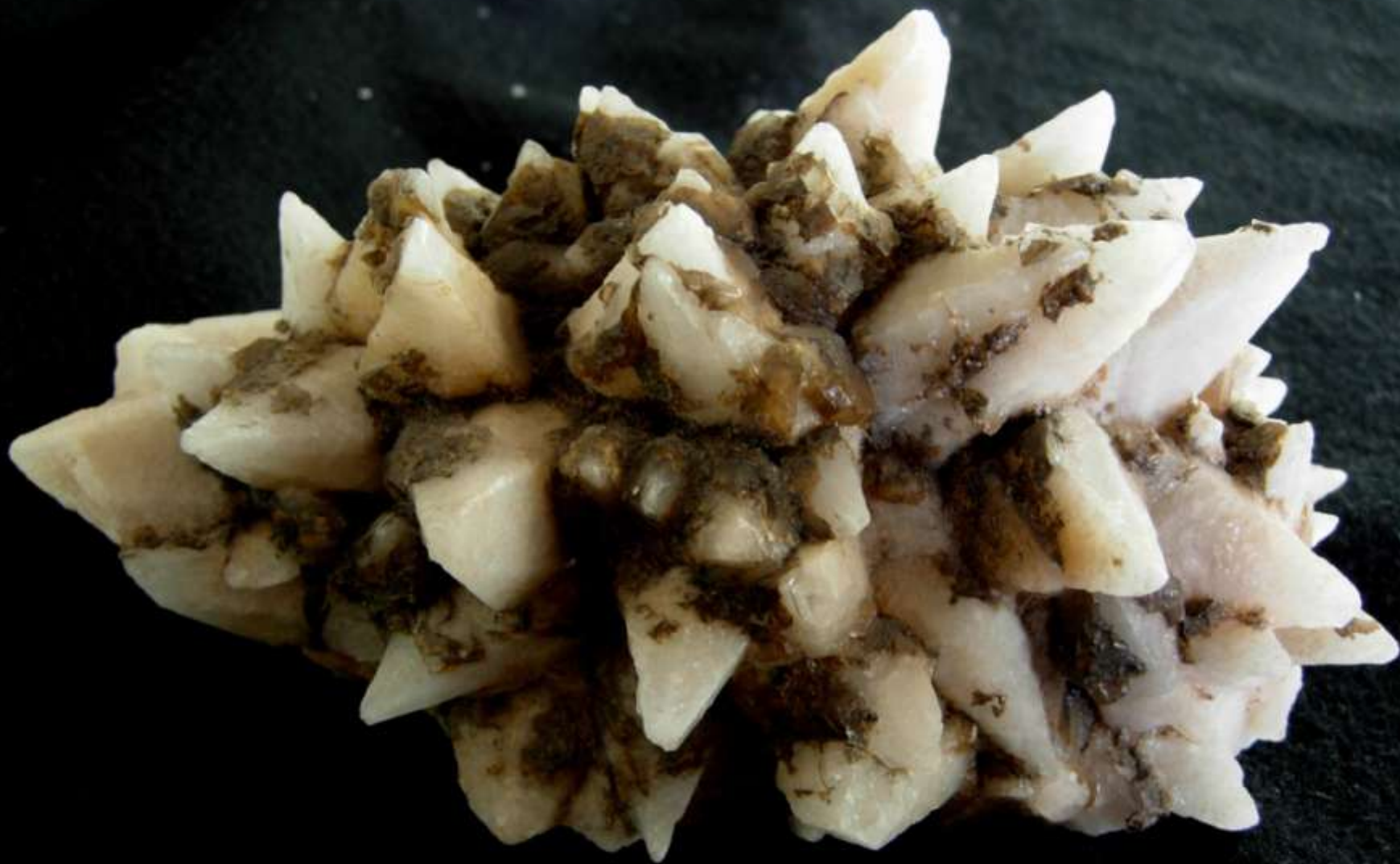
Calcite - Iglesiasite - 120 mm