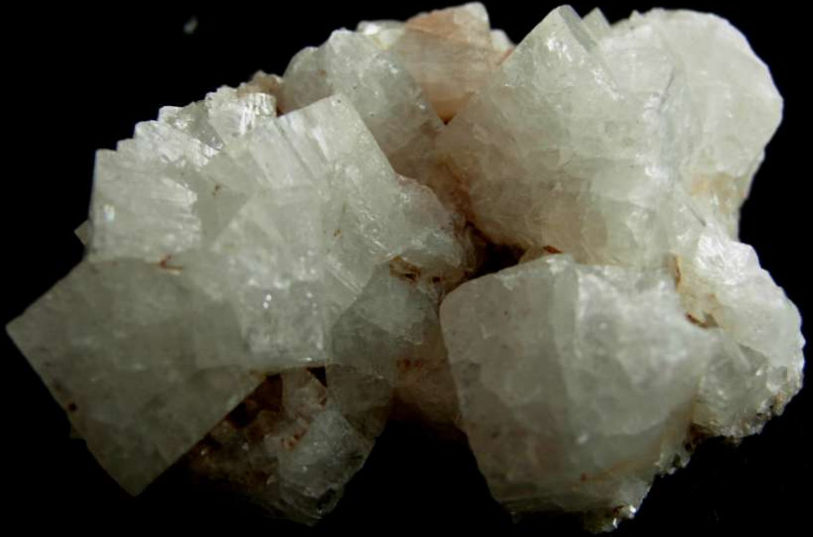
Cabasite-Ca - Fær Øer (Danimarca) - 40 mm