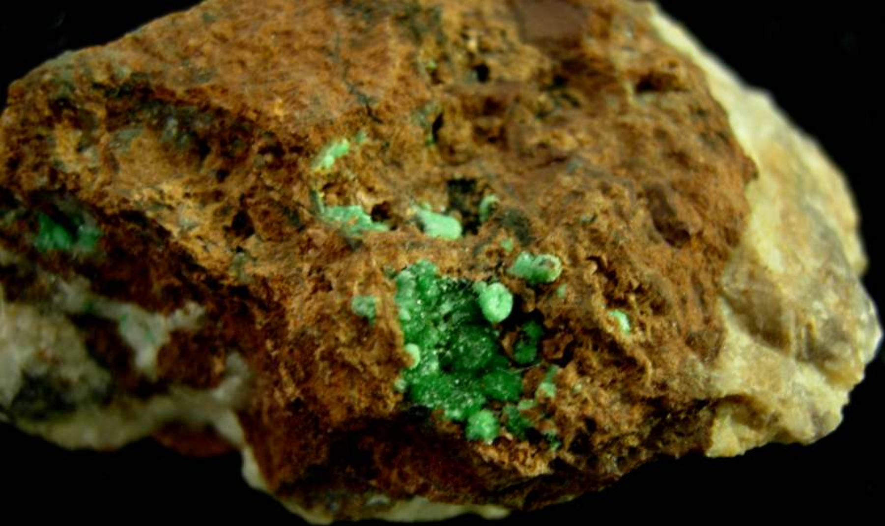
Cabrerite - Laurion (Grecia) - 40 mm