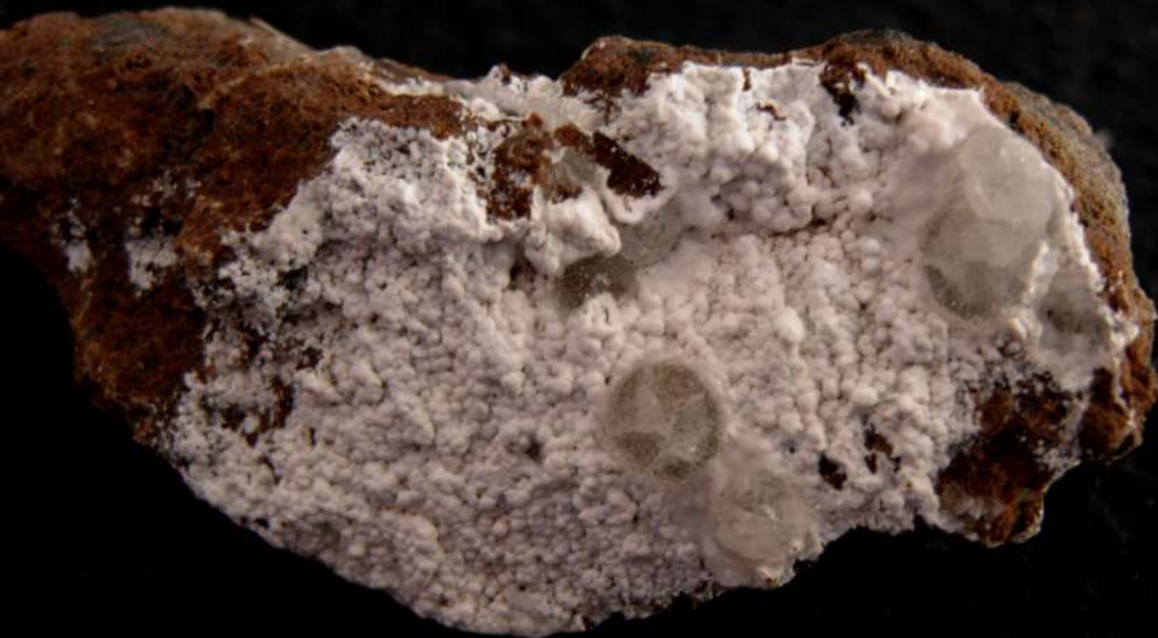
Cabasite-Na e phillipsite - Aci Castello (Ct) Sicilia - 70 mm