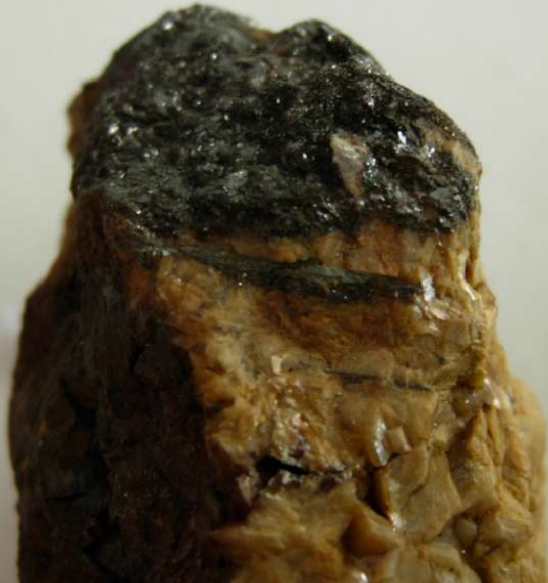
Bismutinite - Brosso, Ivrea (To) - 30 mm