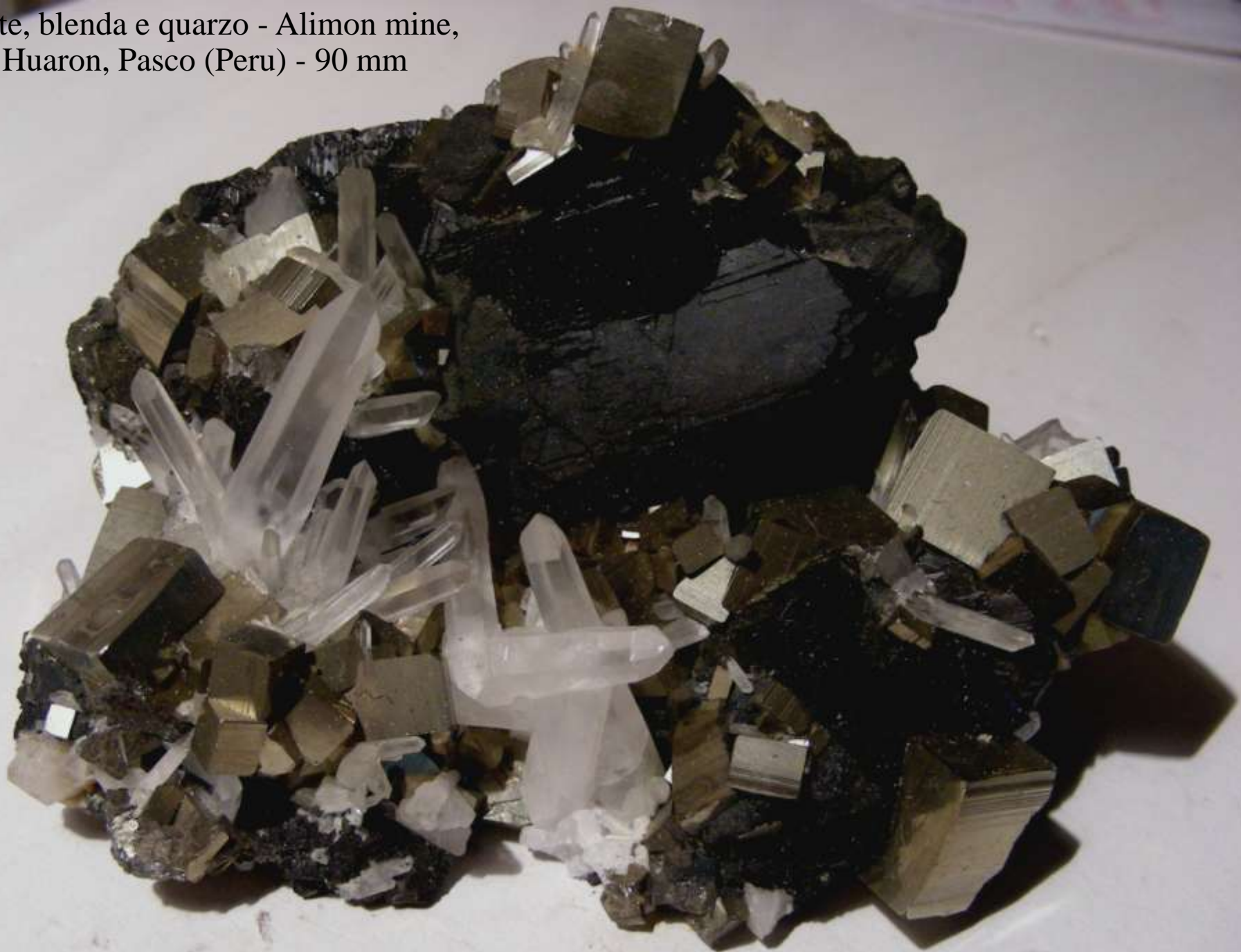
Pirite, blenda e quarzo - Alimon mine, Huaron, Pasco (Peru) - 90 mm