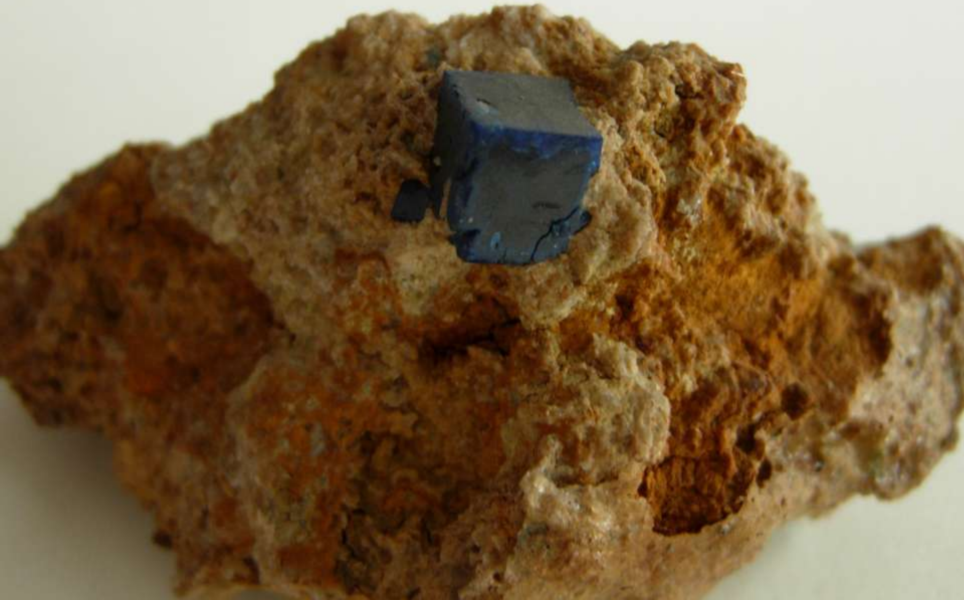
Boleite - Santa Rosalia, Boleo, Baja California Sur (Messico) - 50 mm