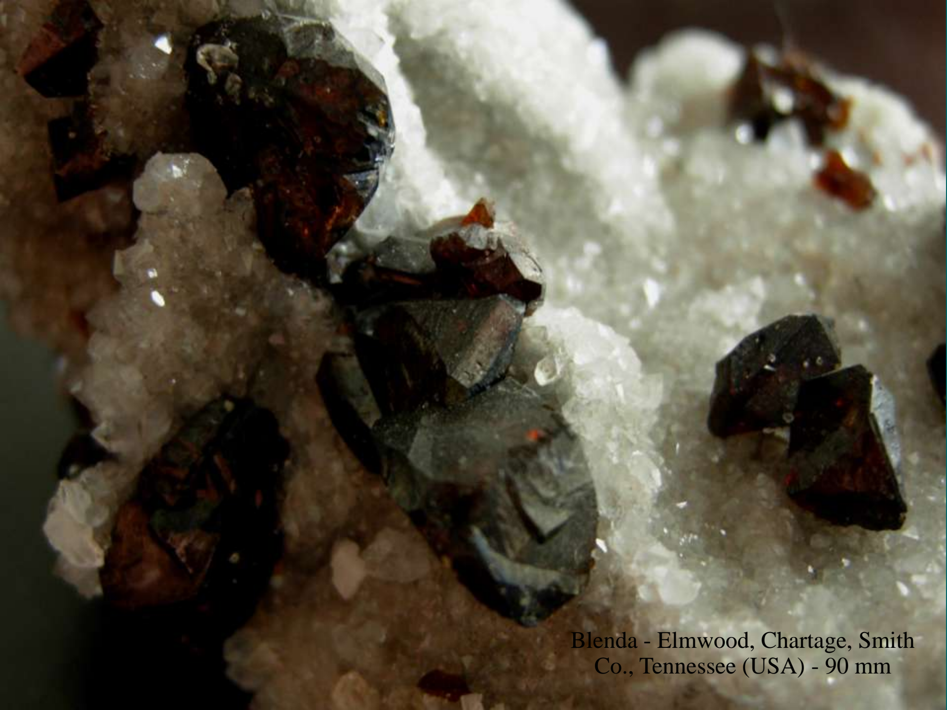
Blenda - Elmwood, Chartage, Smith Co., Tennessee (USA) - 90 mm