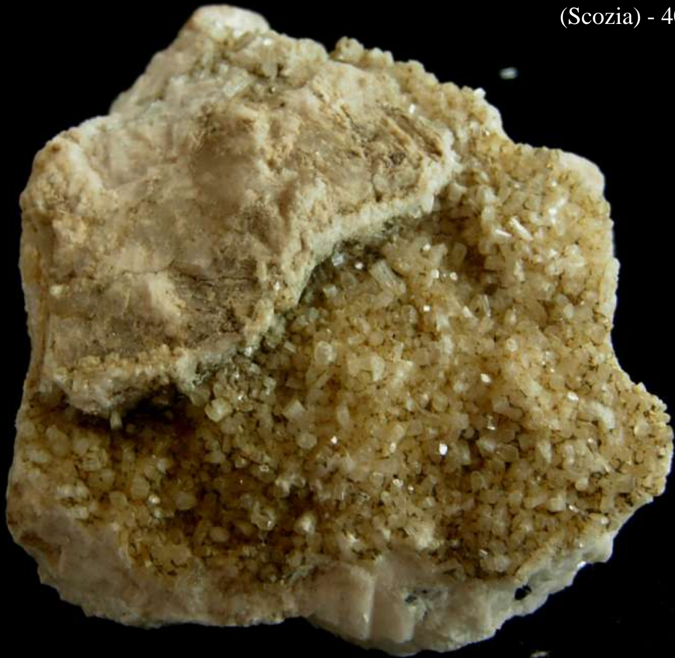
Brewsterite - Strontian (Scozia) - 40mm