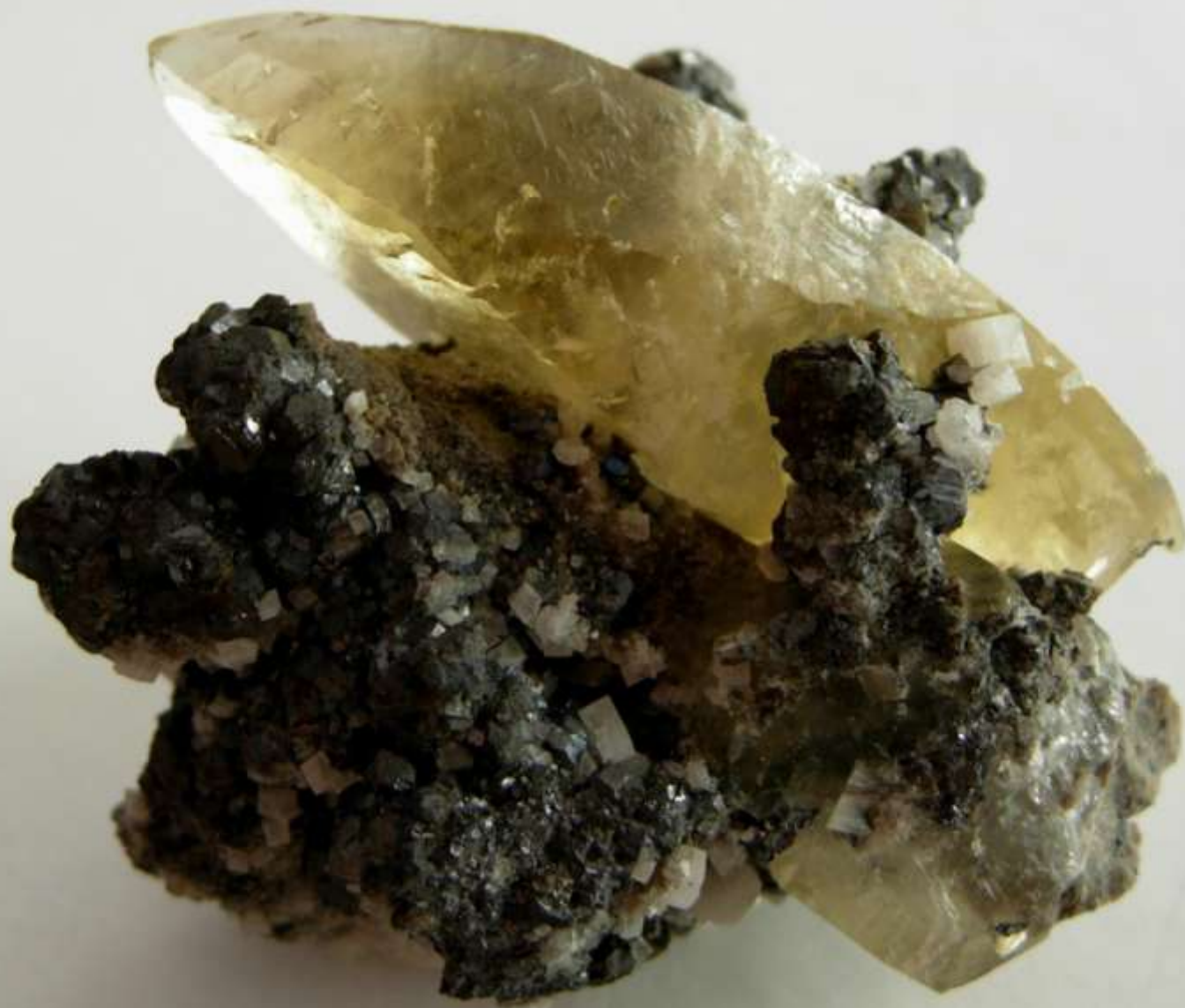
Calcite su galena - Joplin, Jasper Co., Missouri (USA) - 60 mm