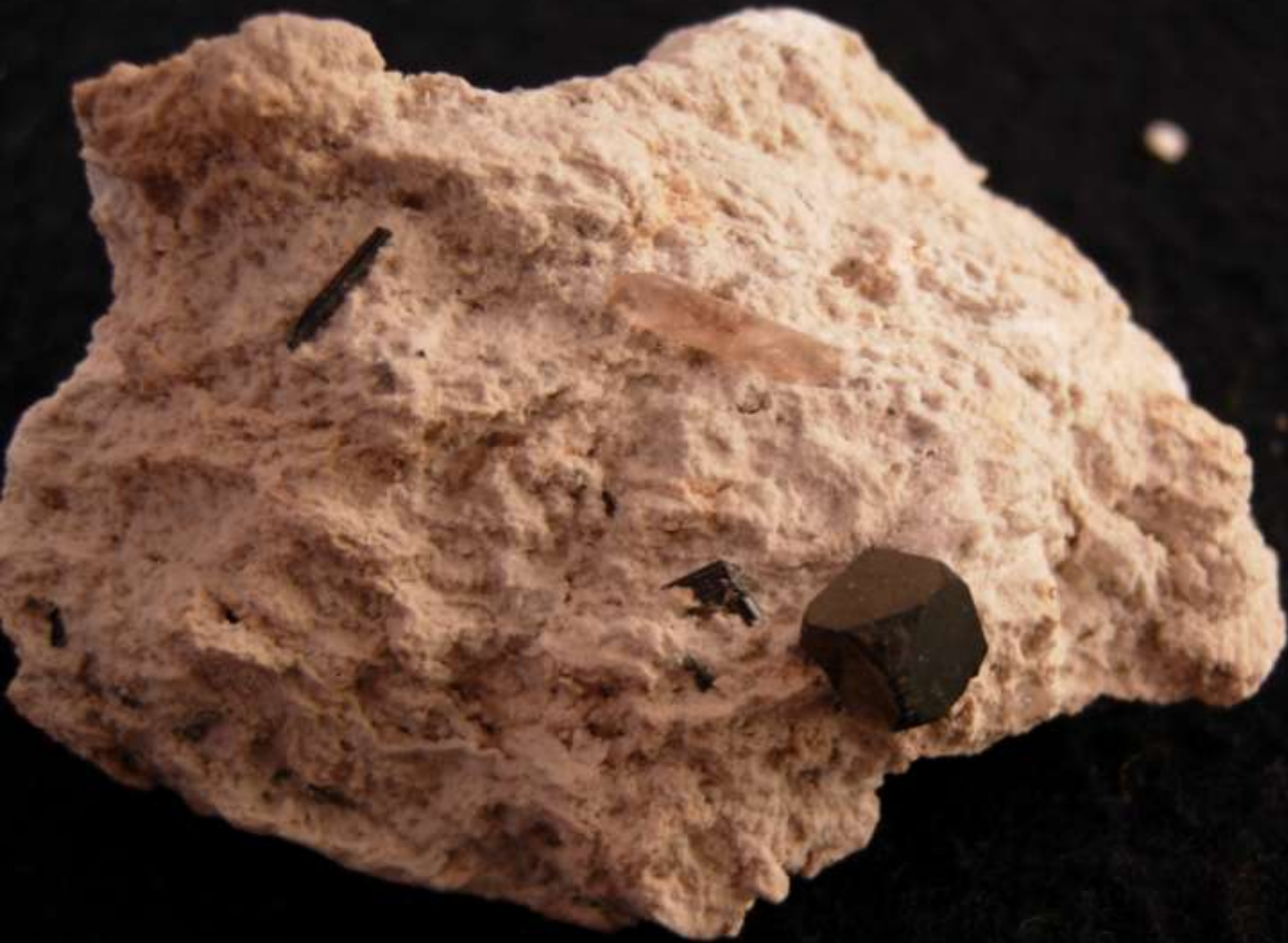
Bixbyite e topazio - Thomas Range, Delta, Juab Co., Utah (USA) - 60 mm