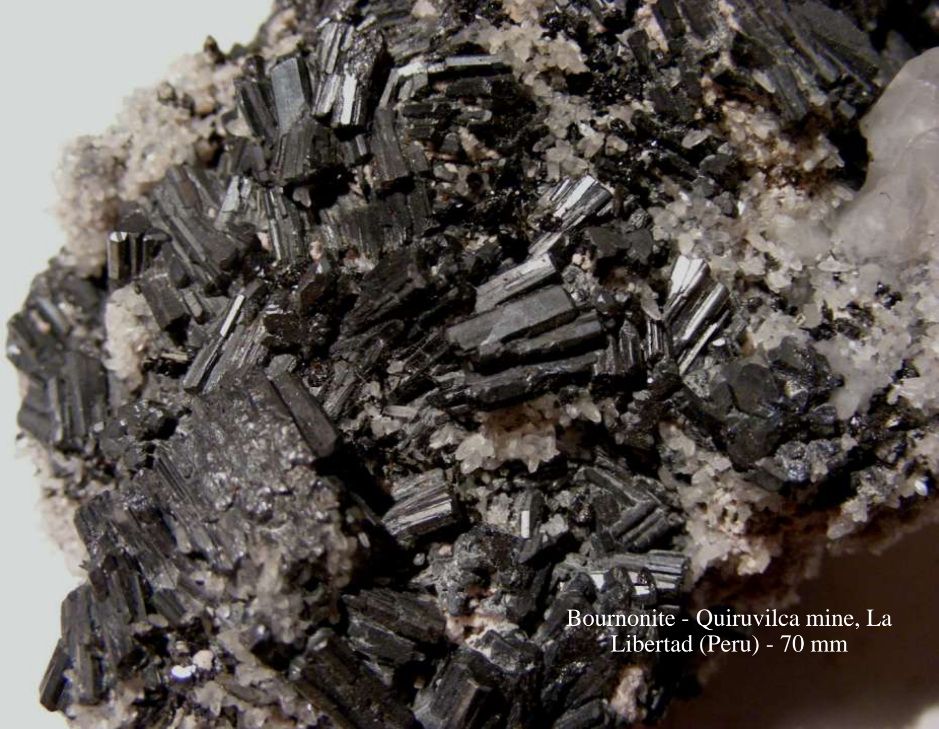
Bournonite - Quiruvilca mine, La Libertad (Peru) - 70 mm