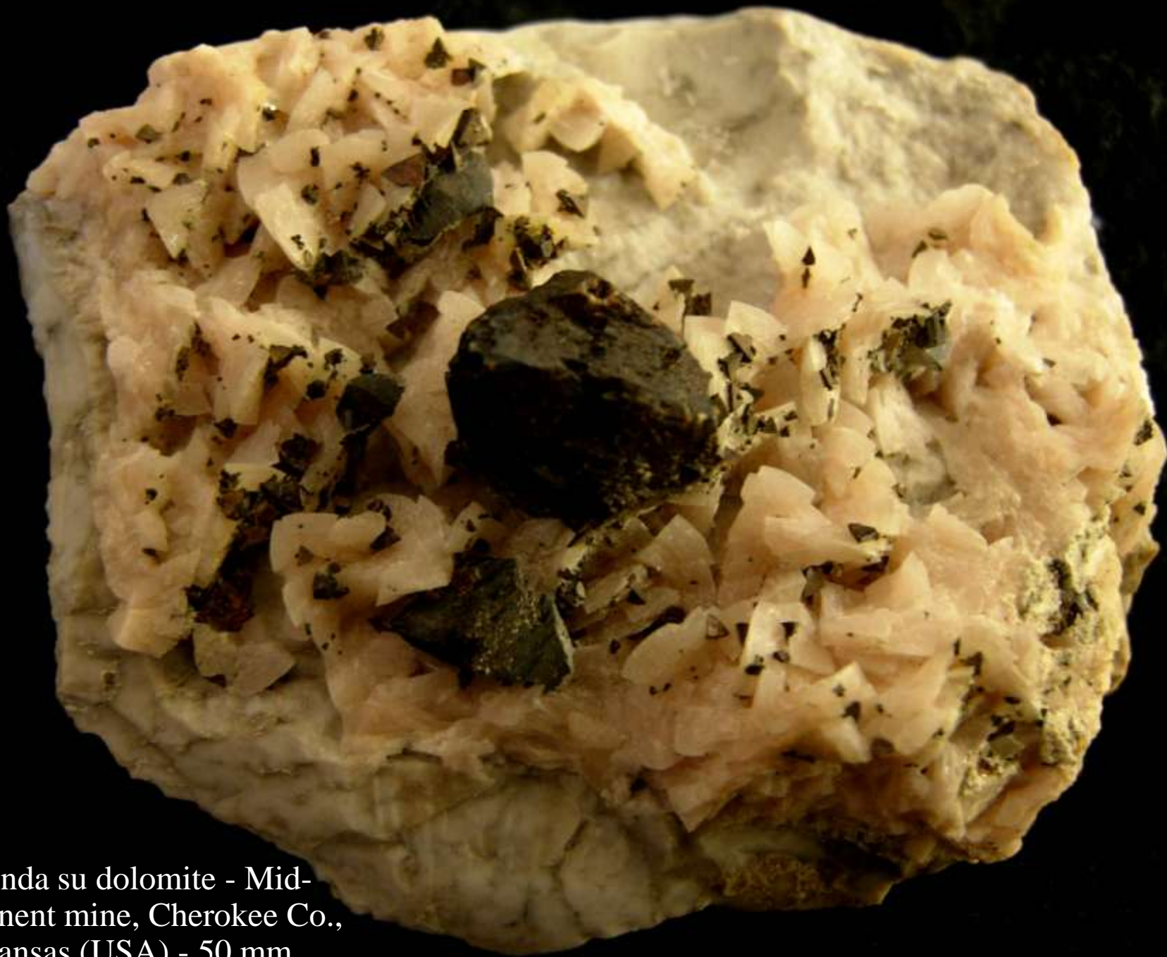
Blenda su dolomite - Mid- Continent mine, Cherokee Co., Kansas (USA) - 50 mm