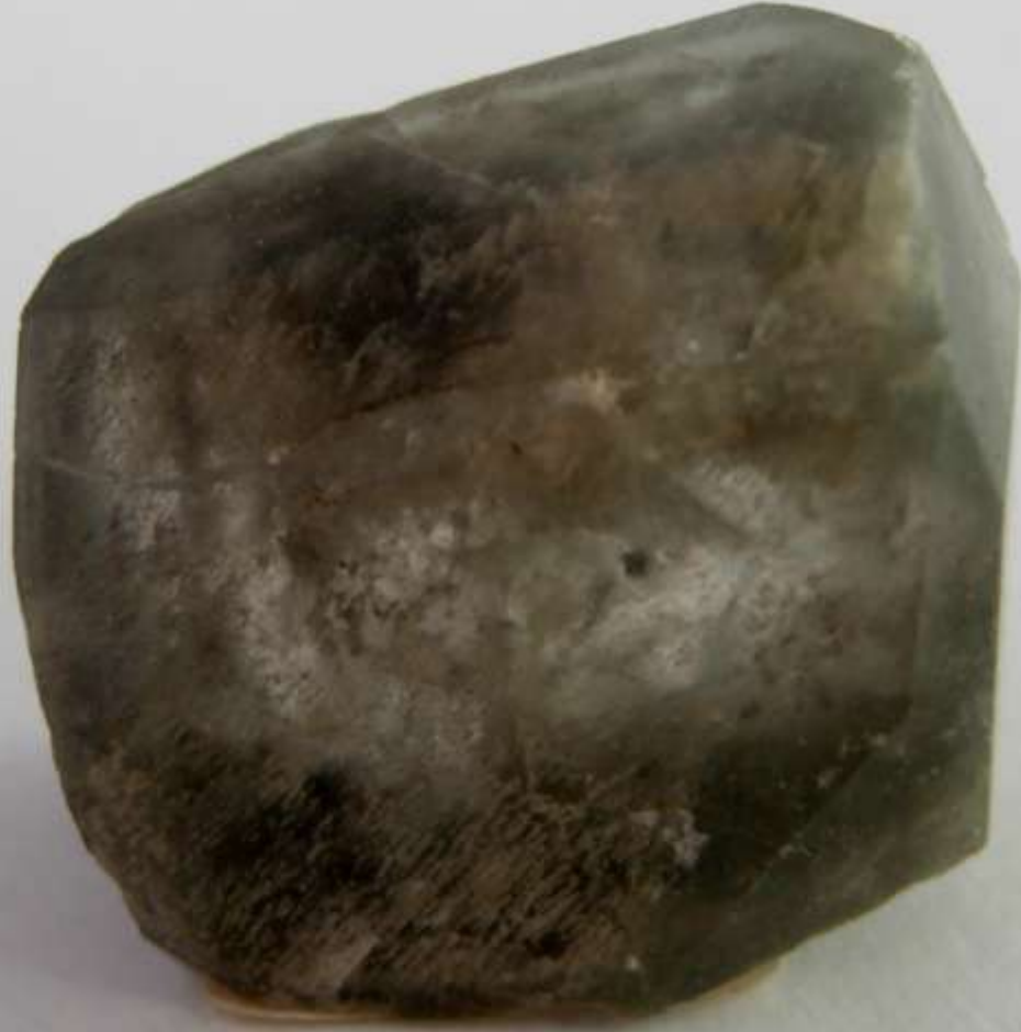
Bloedite - Soda Lake, California (USA) - 26 mm