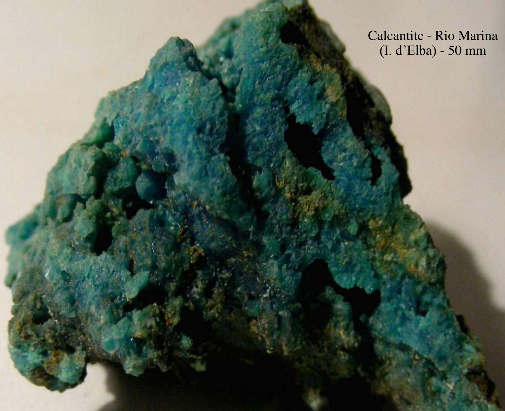
Calcantite - Rio Marina (I. d'Elba) - 50 mm