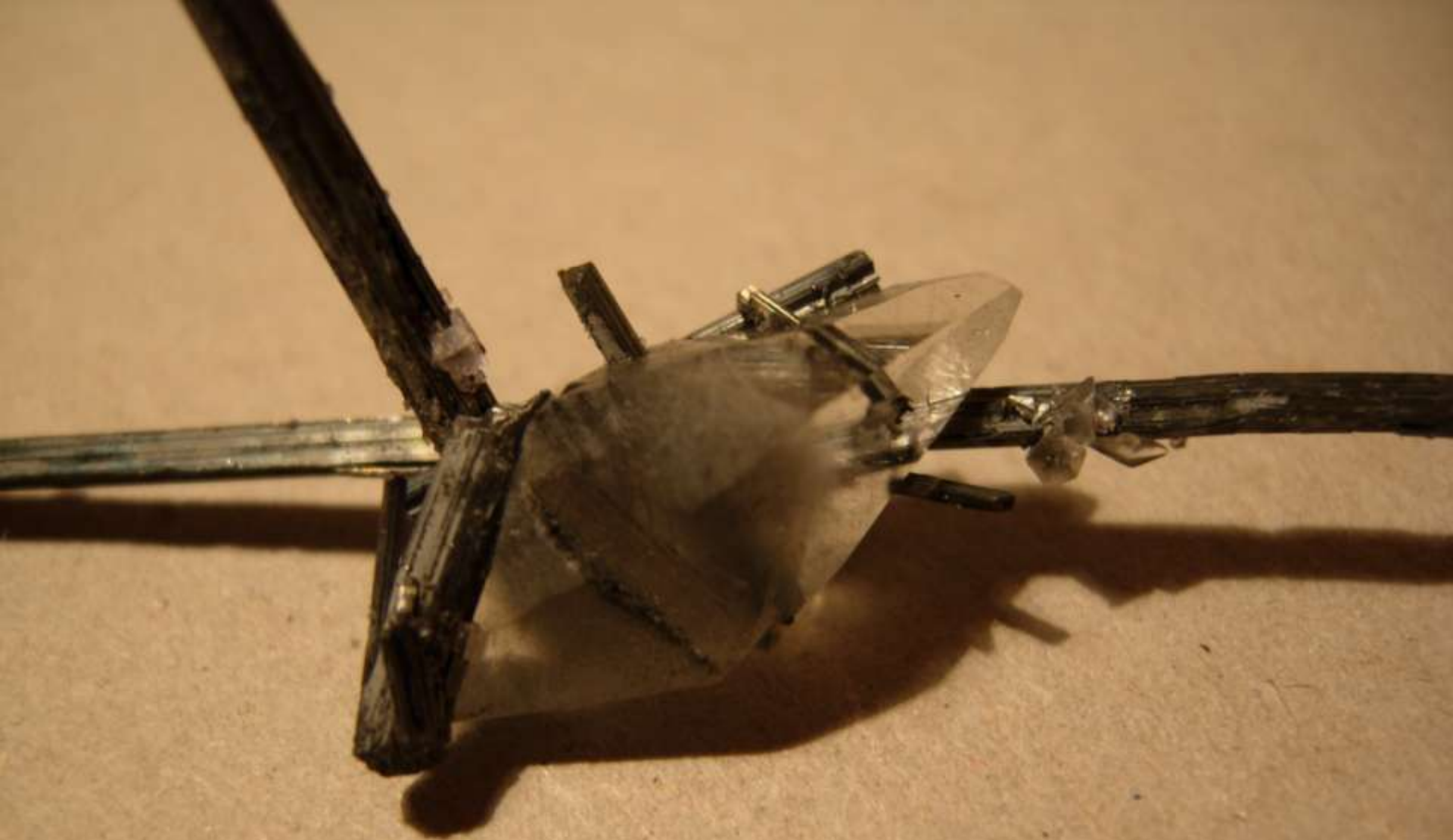
Calcite e antimonite - Kadamdzhay, Alai Mts. (Kirgistan) - 40 mm