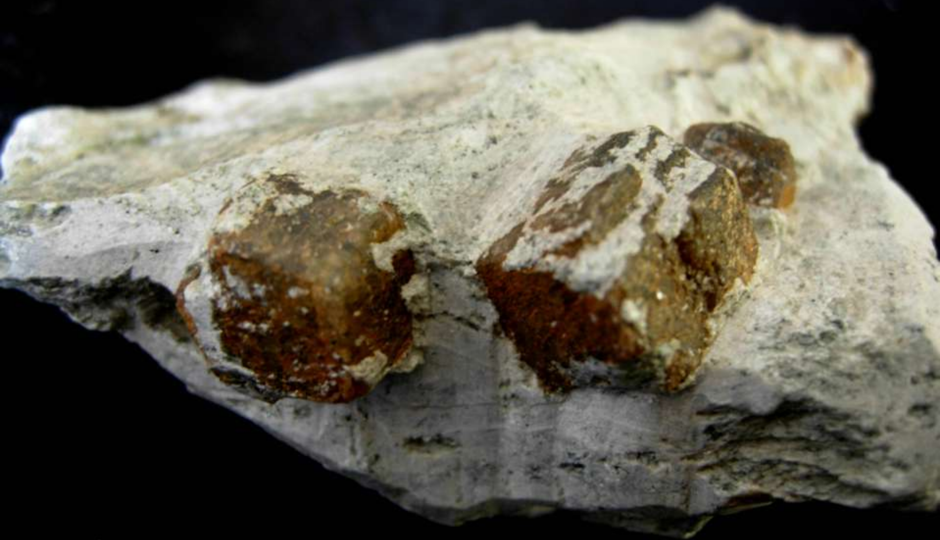
Breunnerite su talco - Val di Vizze (Bz) - 80 mm