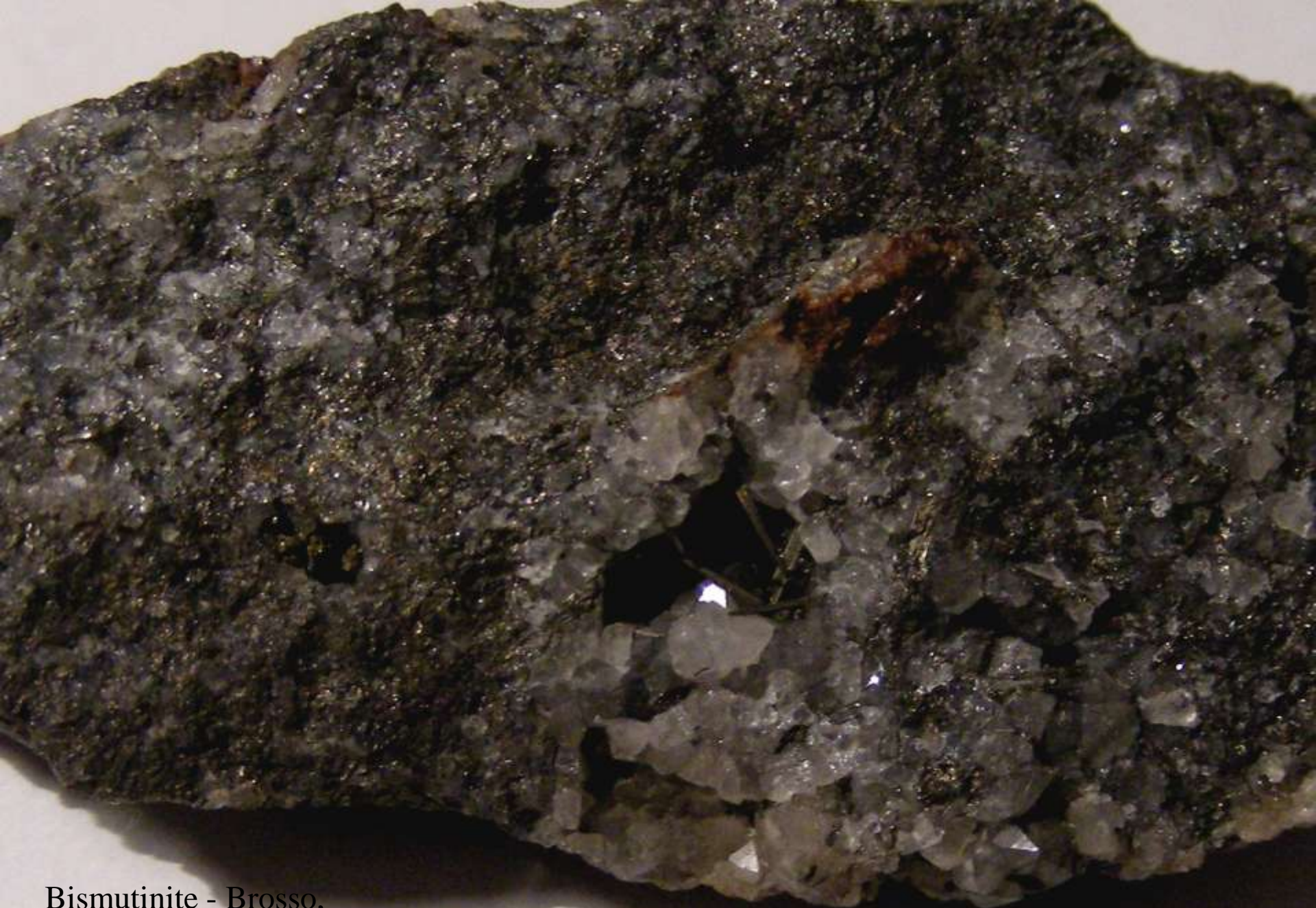
Bismutinite - Brosso, Ivrea (To) - 30 mm