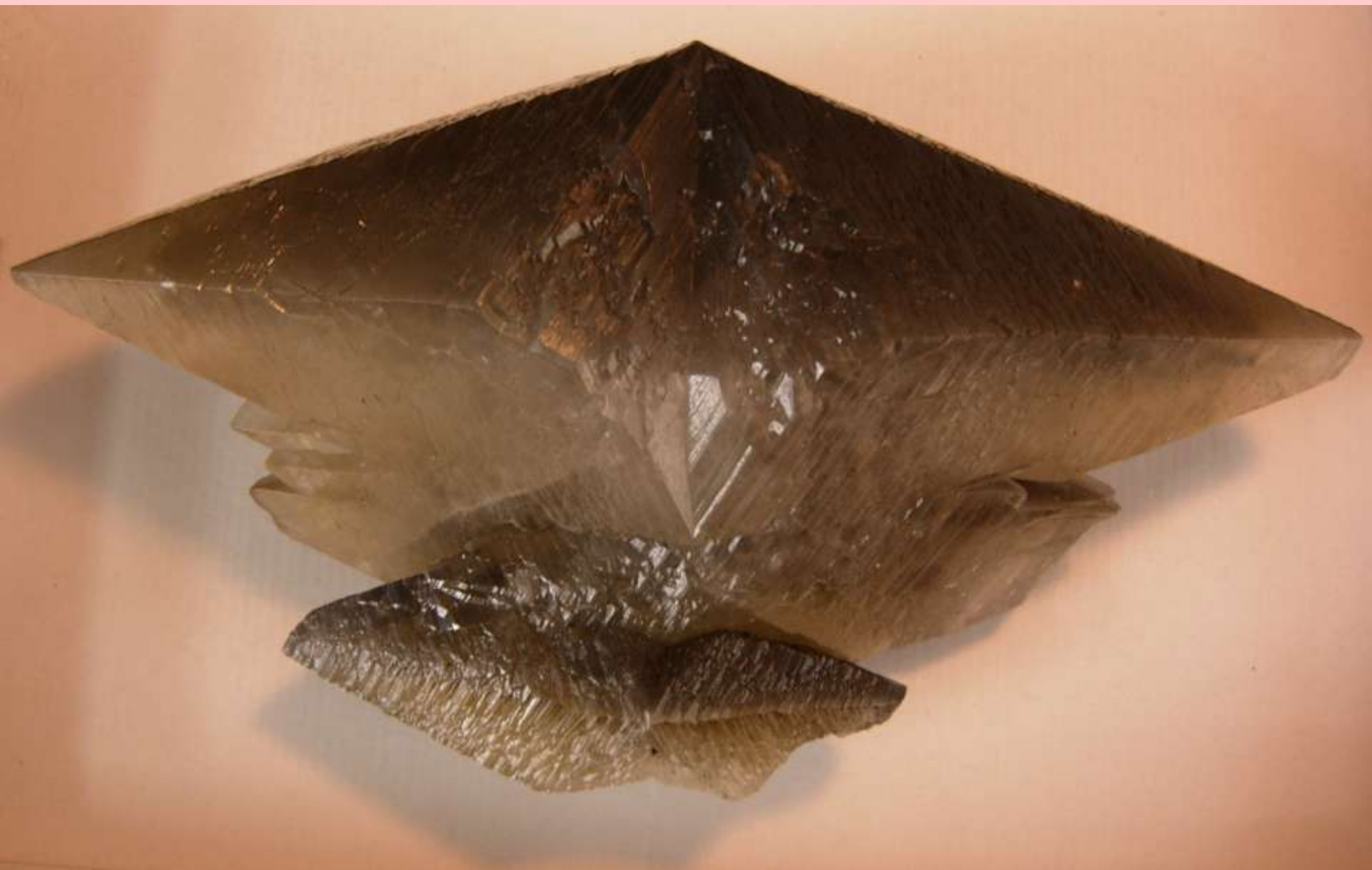
Calcite - Cina - 400 mm