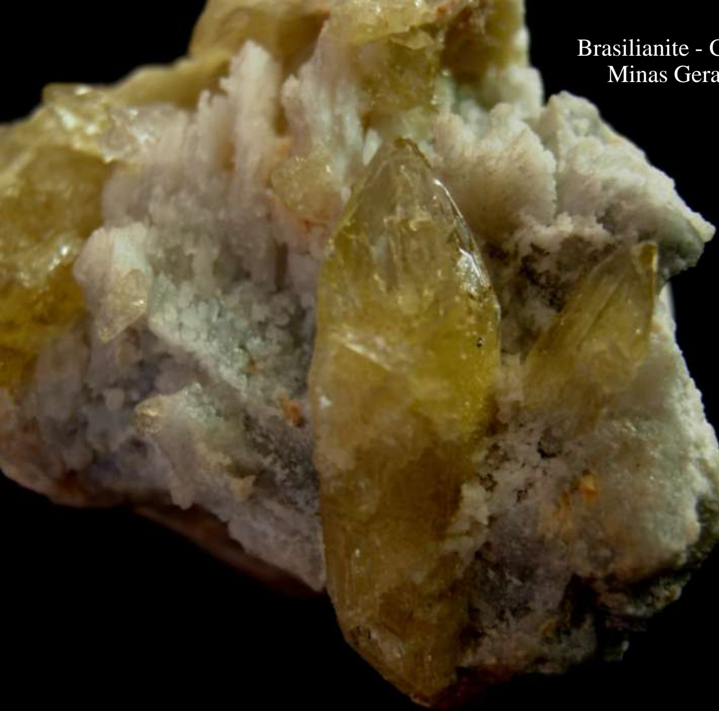
Brasilianite - Corrego Frio, Linopolis, Minas Gerais (Brasile) - 60 mm