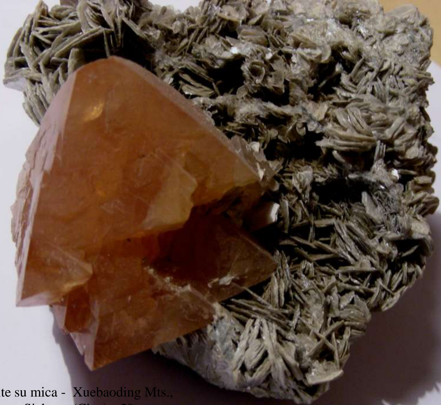
Scheelite su mica - Xuebaoding Mts., Pingwu, Sichuan (Cina) - 50 mm