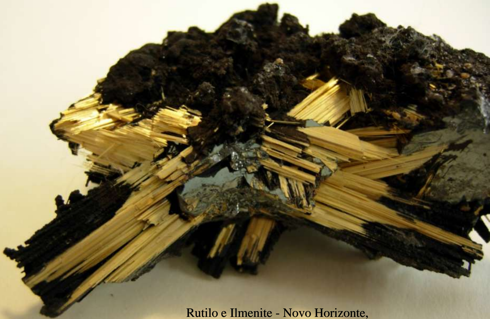
Rutilo e Ilmenite - Novo Horizonte, Ibitiara, Bahia (Brasile) - 50 mm