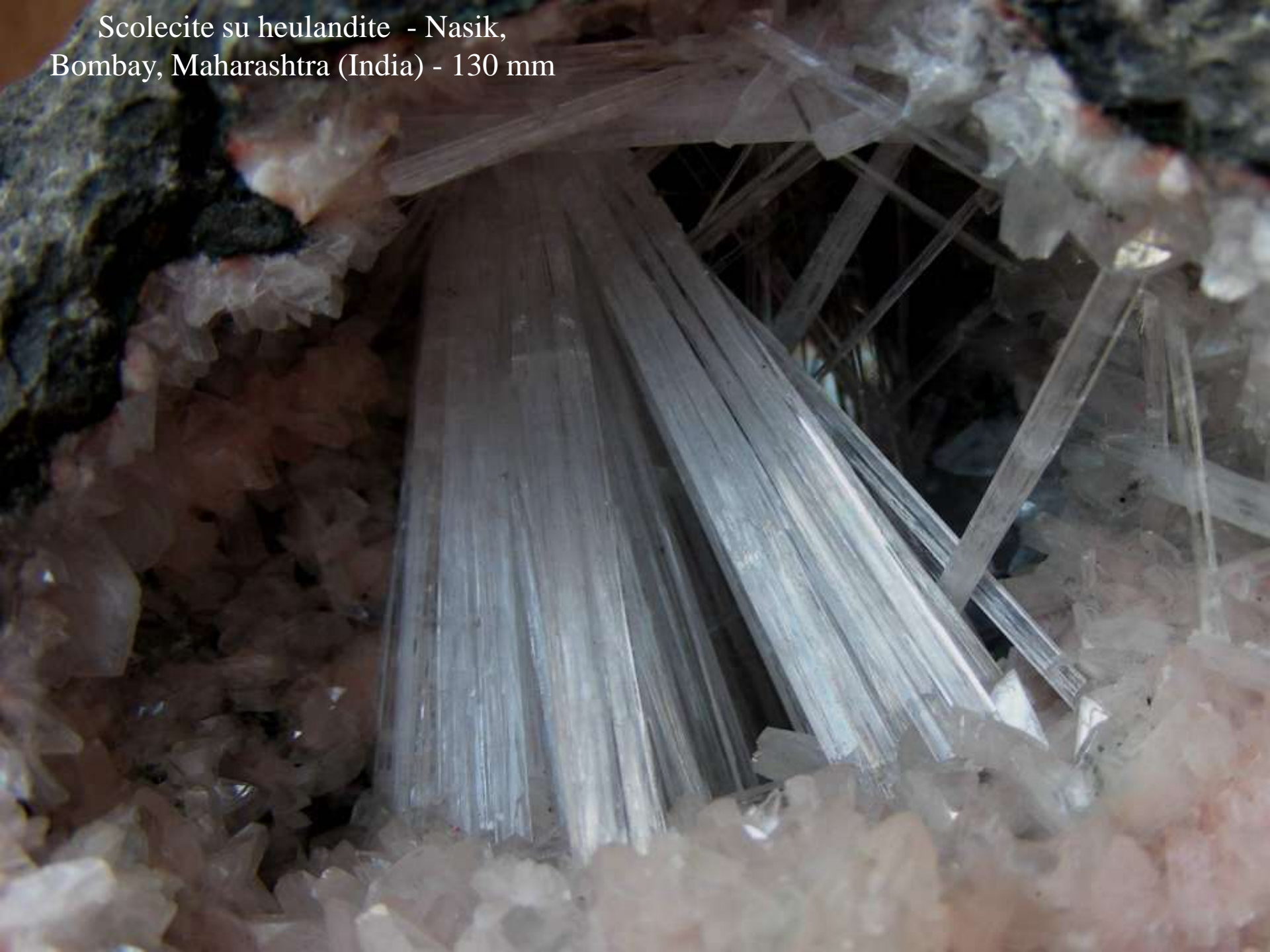
Scolecite su heulandite - Nasik, Bombay, Maharashtra (India) - 130 mm