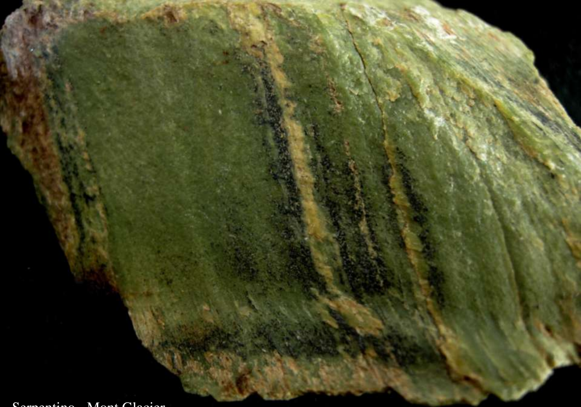
Serpentino - Mont Glacier (Val d'Aosta) - 80 mm