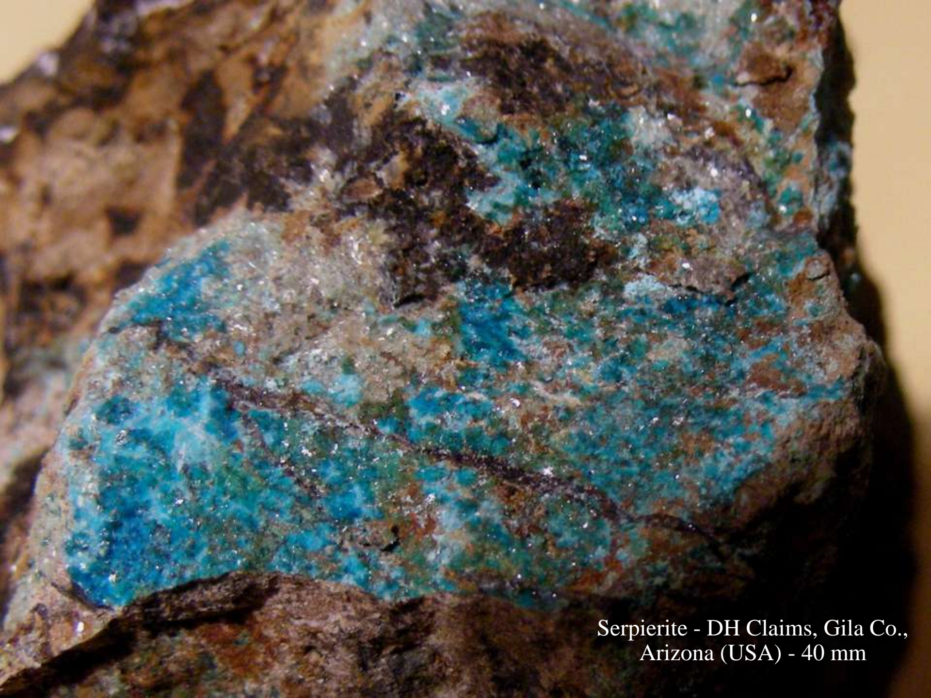
Serpierite - DH Claims, Gila Co., Arizona (USA) - 40 mm