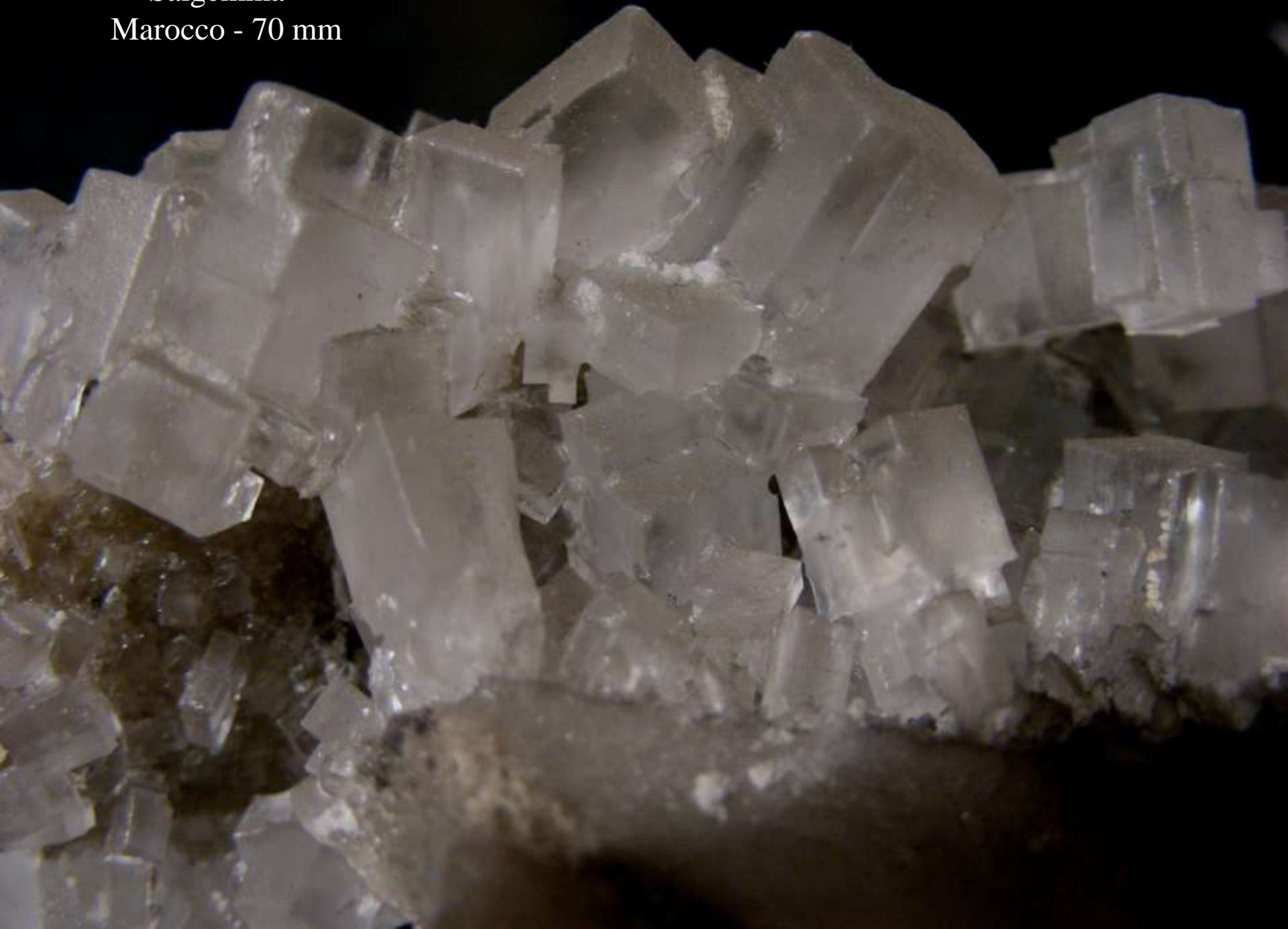
Salgemma - Marocco - 70 mm