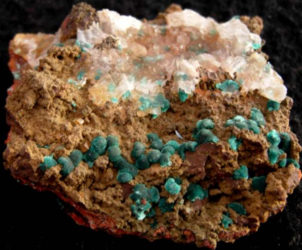
Rosasite - Ojuela mine, Mapimi, Durango (Messico) - 60 mm