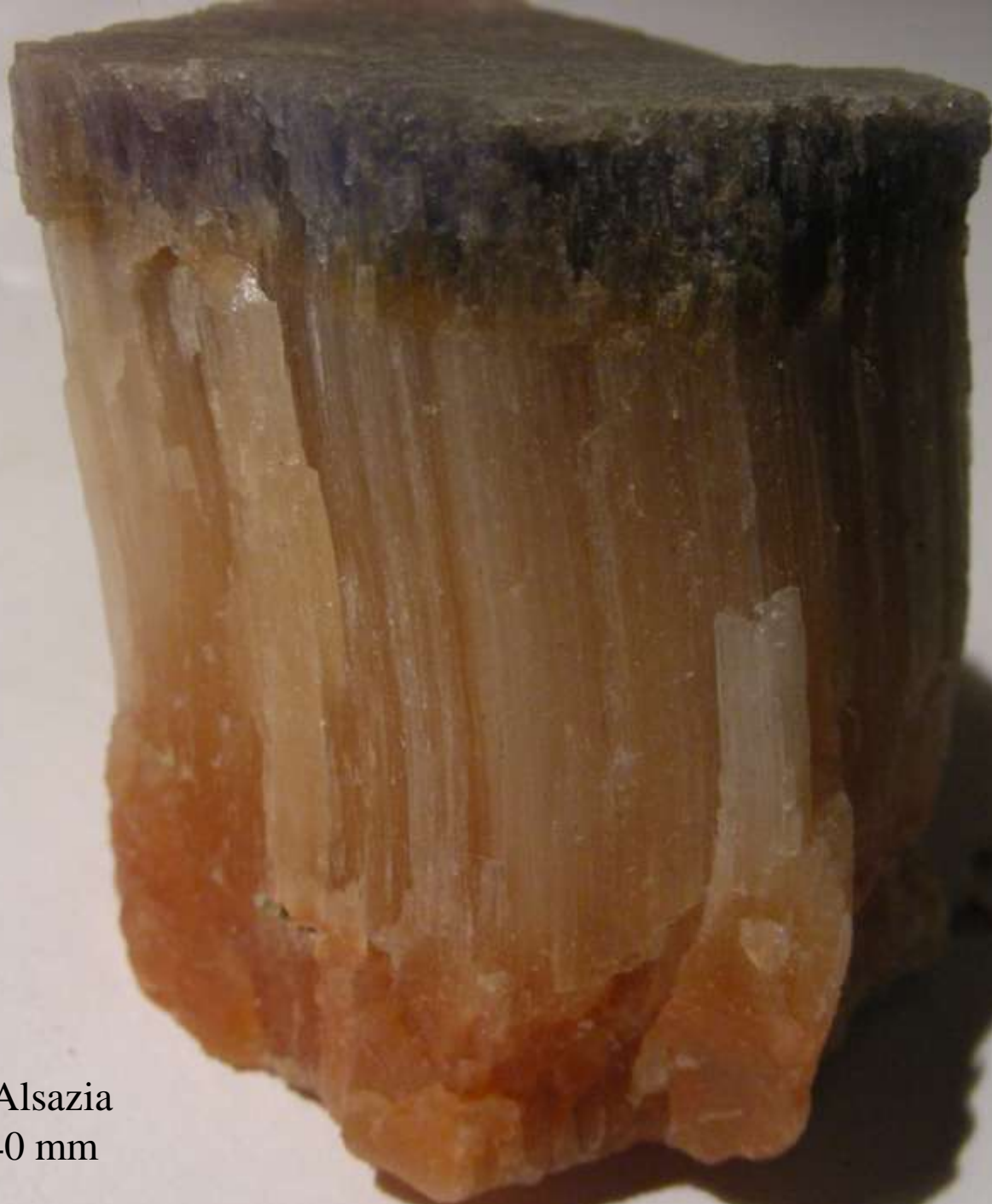
Salgemma - Alsazia (Francia) - 40 mm