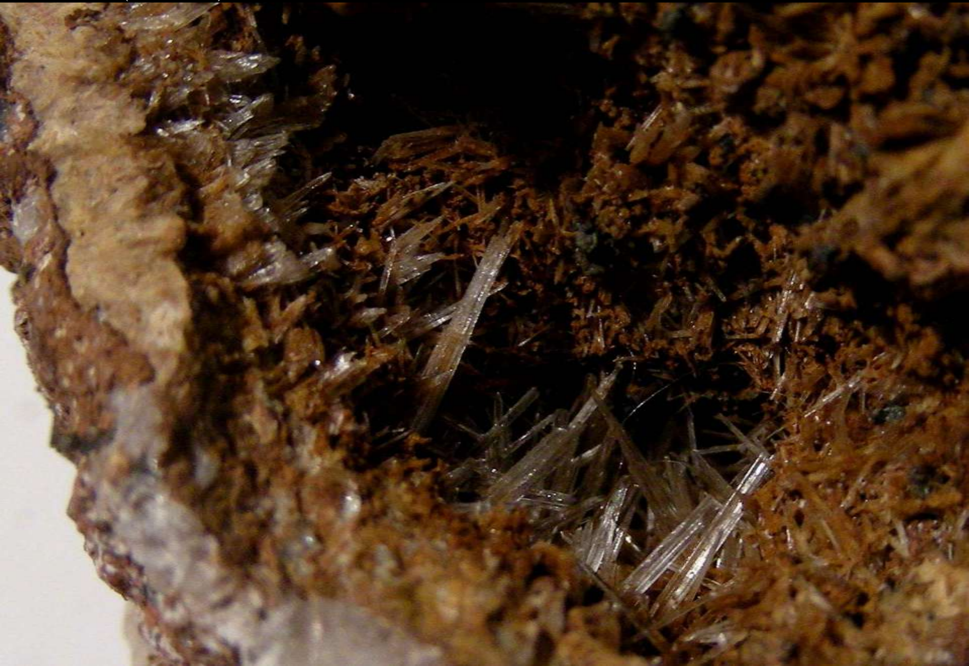
Scholzite - Reaphook Hill, Adelaide (Australia) - 90 mm