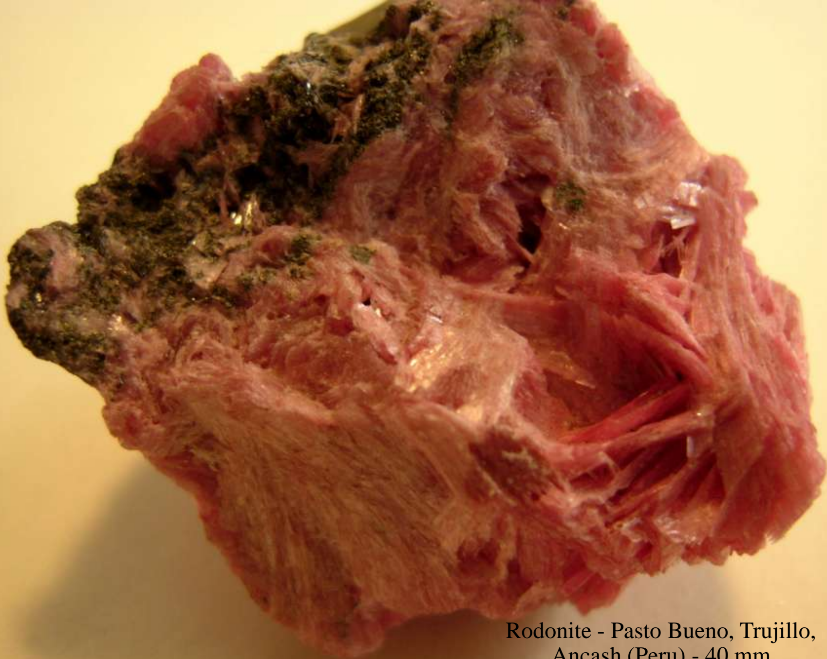
Rodonite - Pasto Bueno, Trujillo, Ancash (Peru) - 40 mm