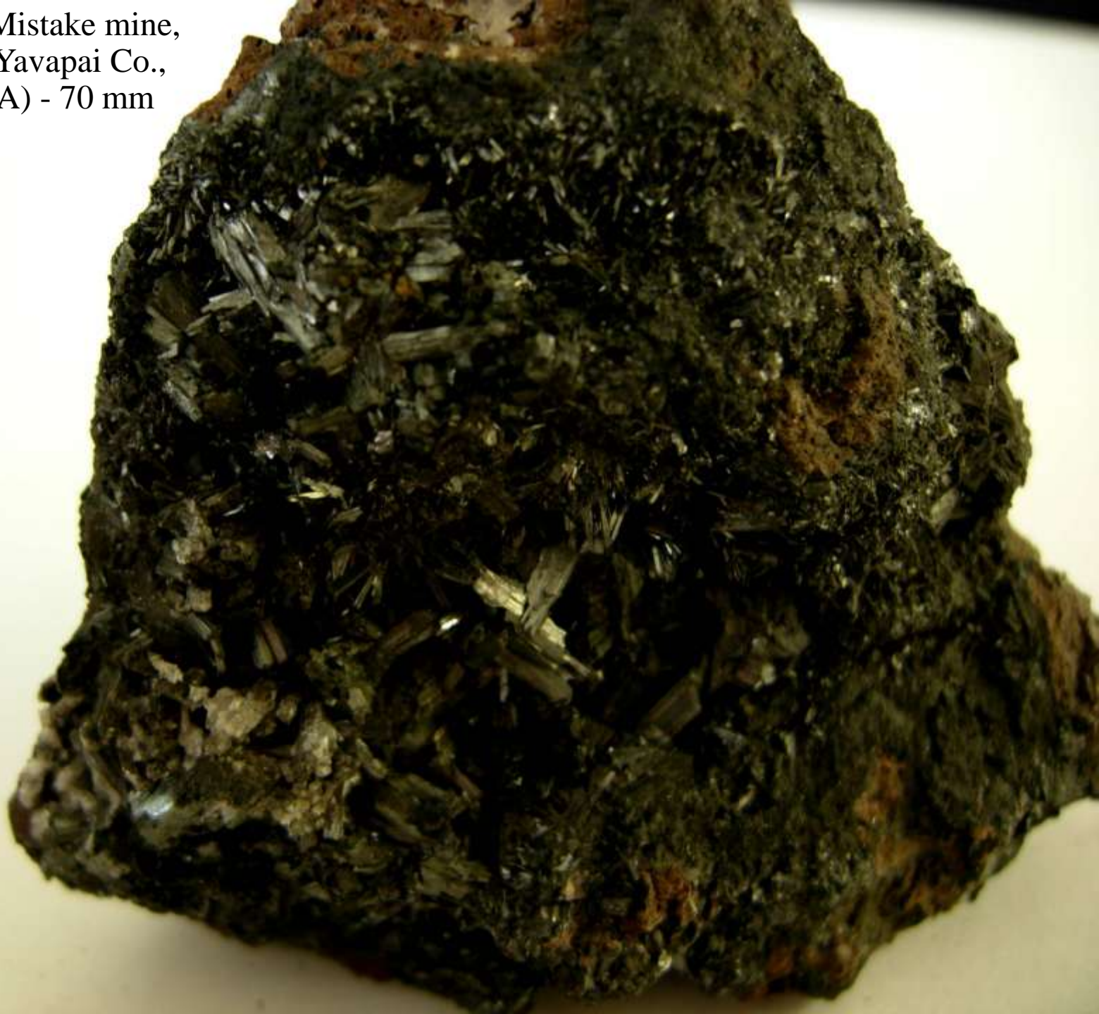
Ramsdellite - Mistake mine, Wickenburg, Yavapai Co., Arizona (USA) - 70 mm