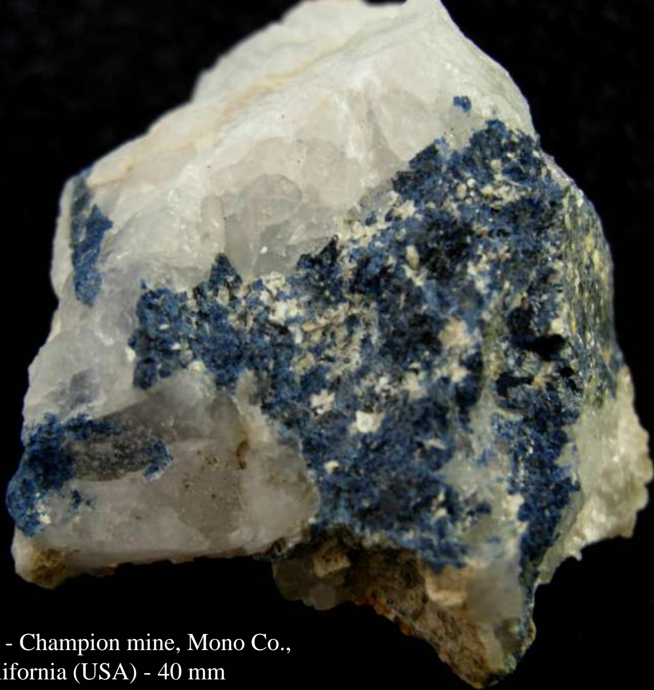
Scorzalite - Champion mine, Mono Co., California (USA) - 40 mm