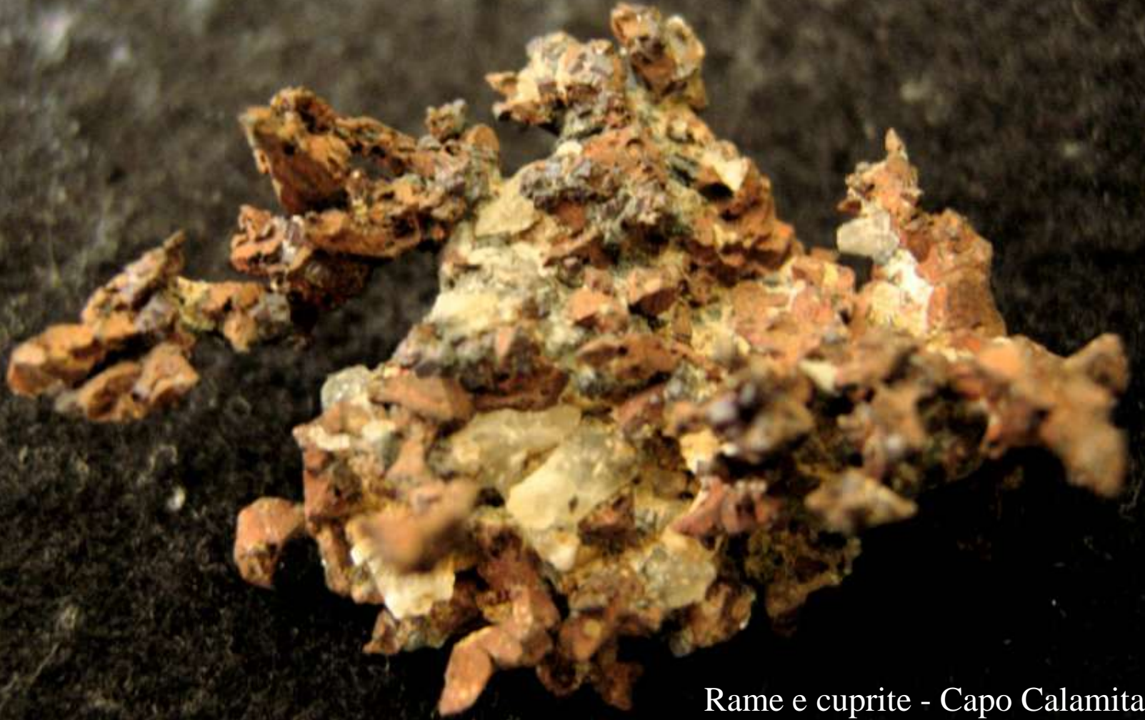
Rame e cuprite - Capo Calamita , I. d'Elba - 40 mm