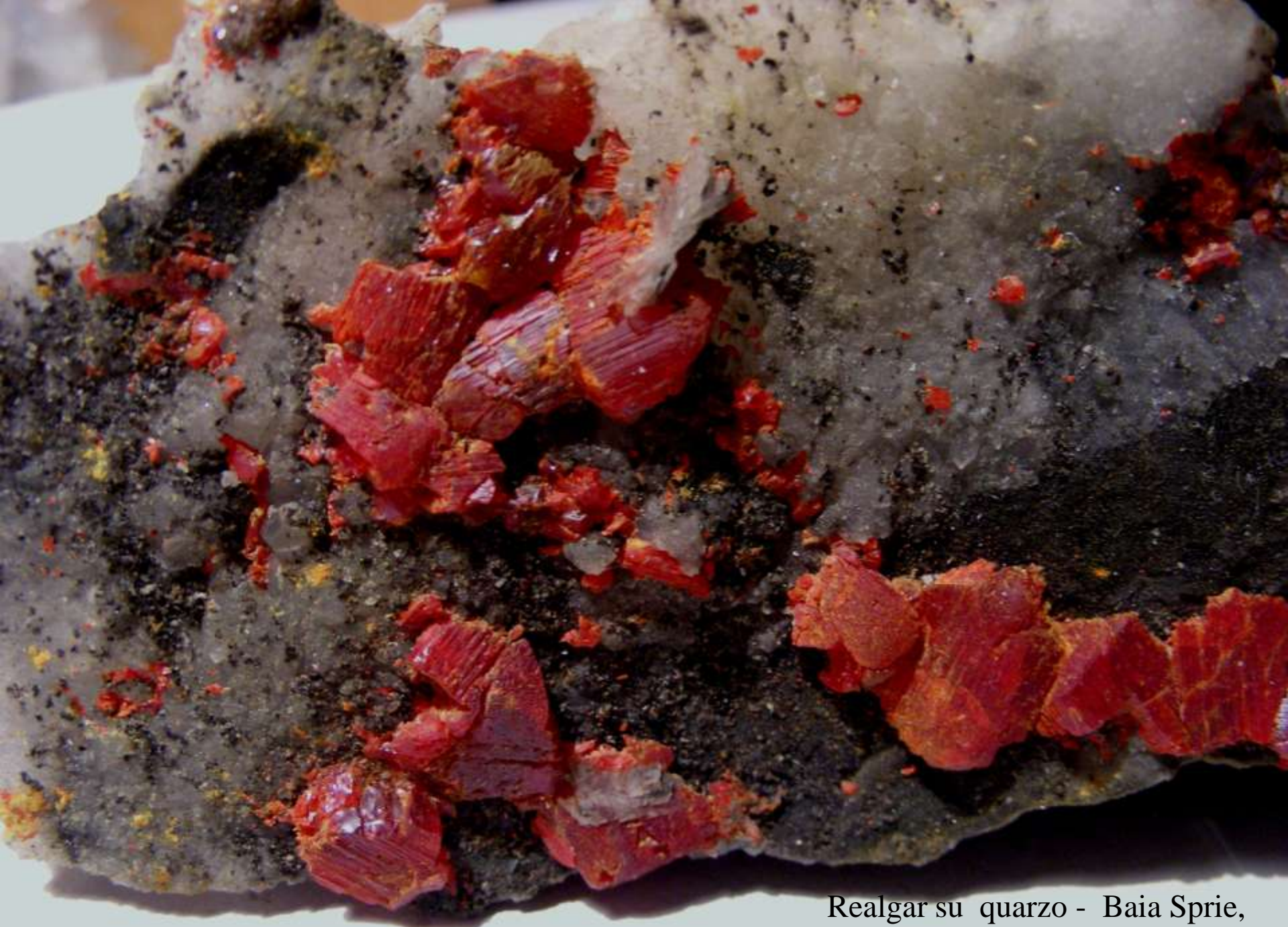
Realgar su quarzo - Baia Sprie, Maramures (Romania) - 90 mm