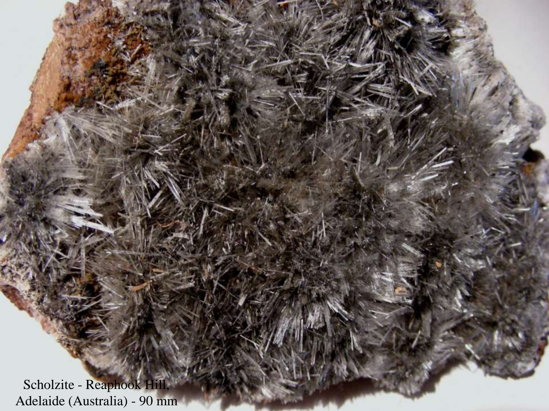
Scholzite - Reaphook Hill, Adelaide (Australia) - 90 mm