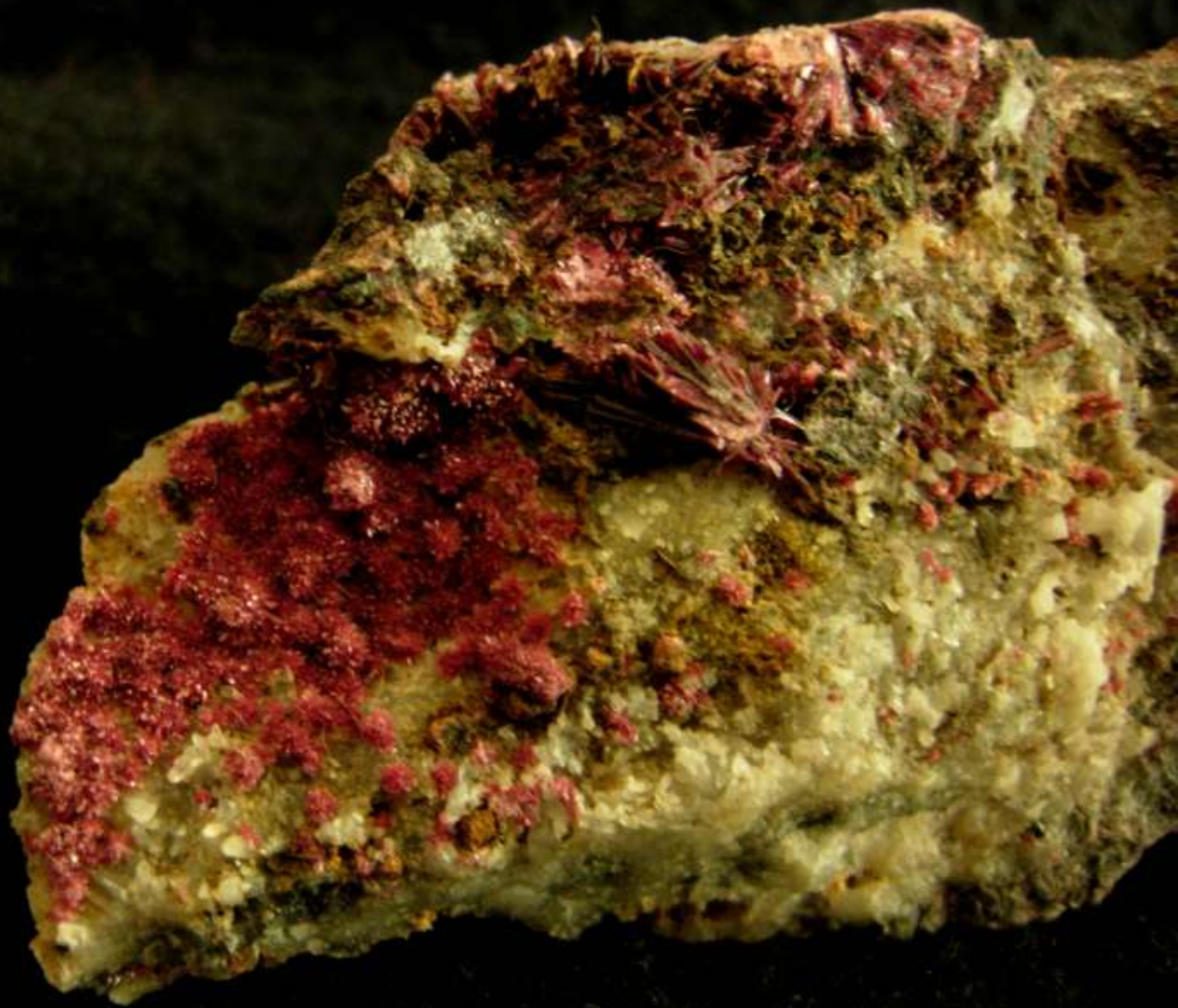
Roselite - Bou Azzer (Marocco) - 60 mm