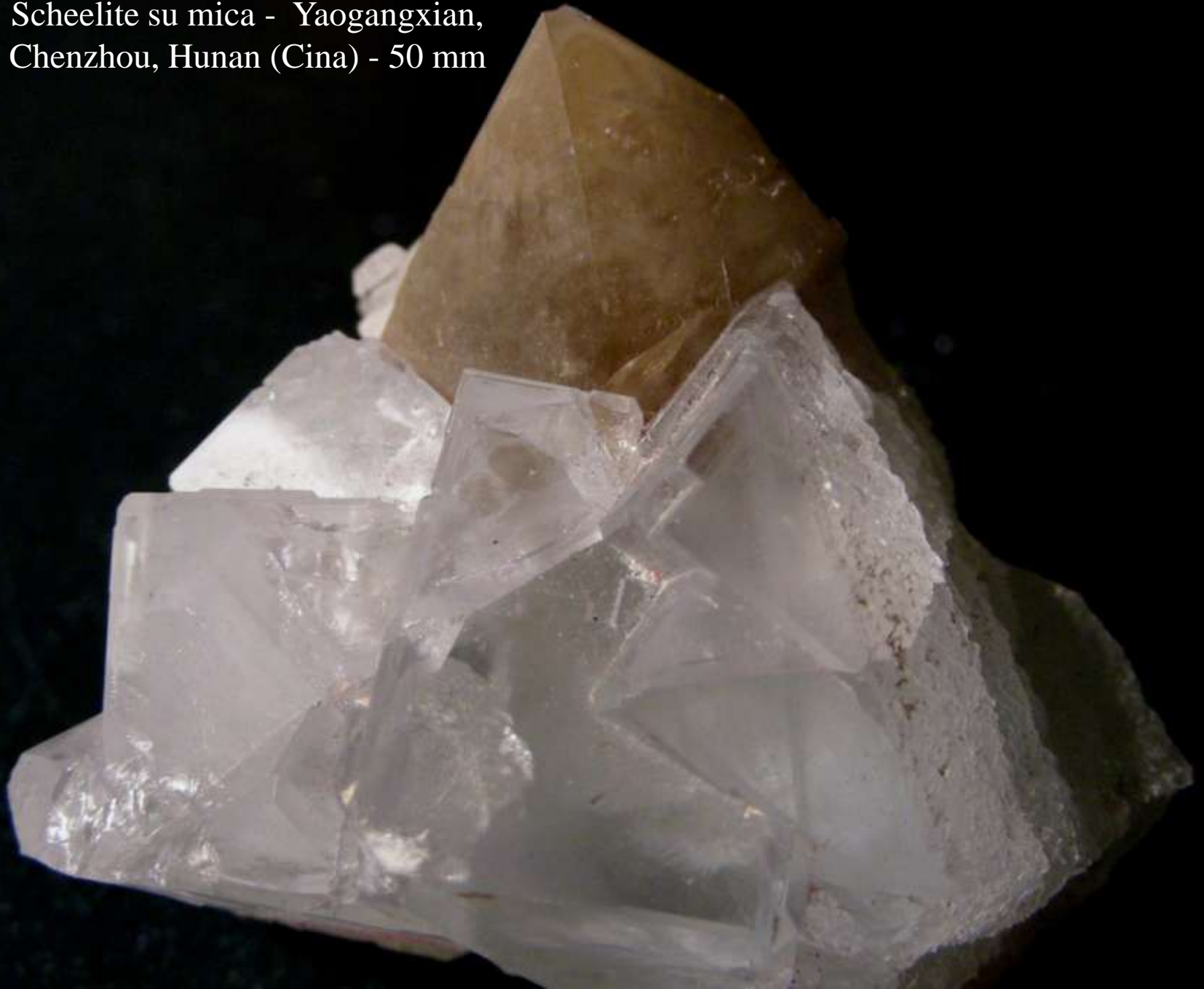
Scheelite su mica - Yaogangxian, Chenzhou, Hunan (Cina) - 50 mm