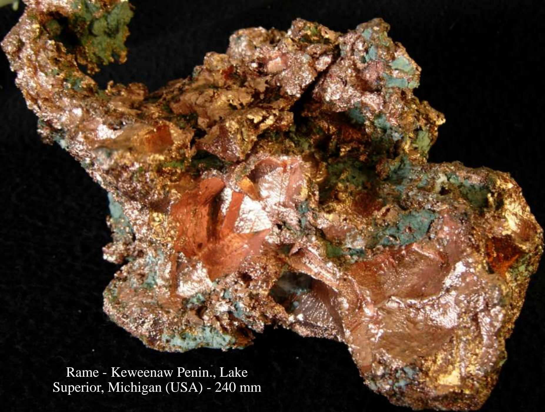
Rame - Keweenaw Penin., Lake Superior, Michigan (USA) - 240 mm