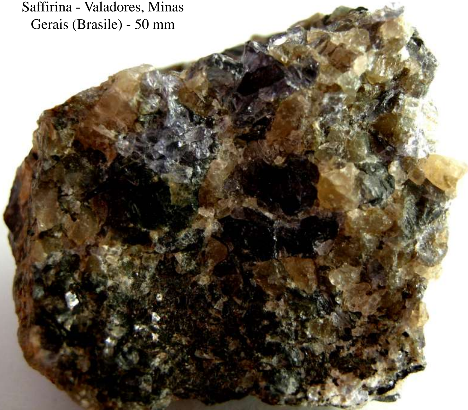
Saffirina - Valadores, Minas Gerais (Brasile) - 50 mm