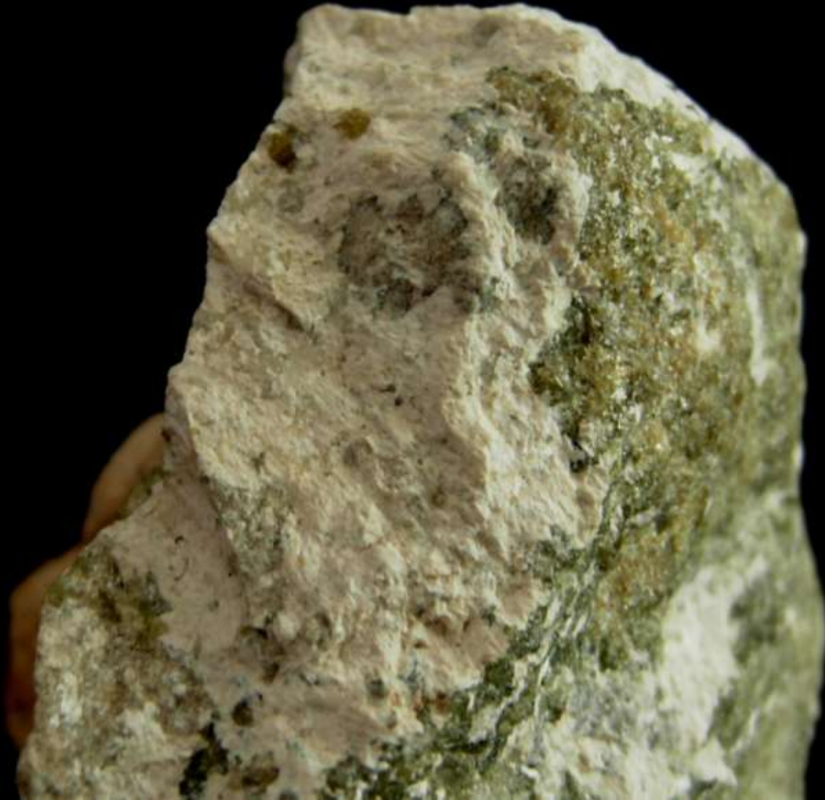
Riversideite (bianco) su idocrasio - Crestmore Quarry, Riverside Co. , California (USA) - 60 mm