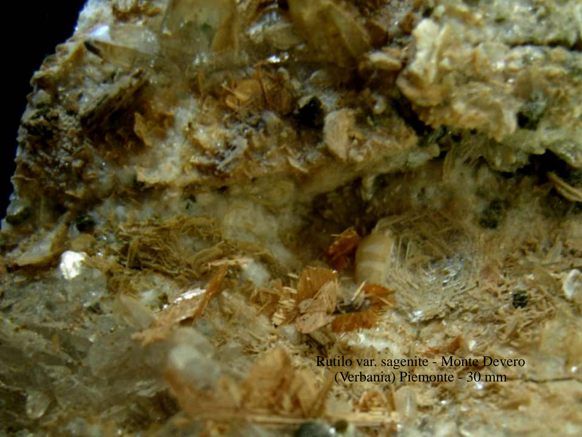
Rutilo var. sagenite - Monte Devero (Verbania) Piemonte - 30 mm